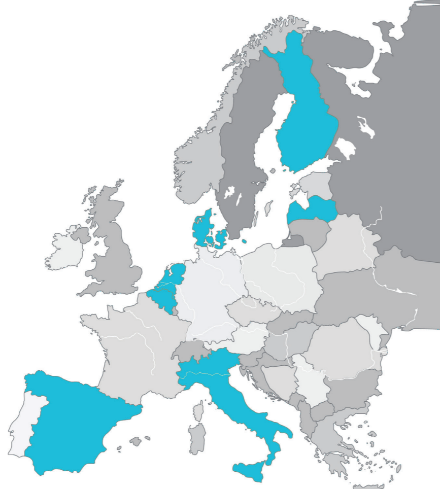
Fig. 1. Dyrkningssystemerne designes og afprøves i 7 europæiske lande.

I SUREVEG udvikles nye økologiske dyrkningssystemer til produktion af grøntsager. Målet er at forbedre systemernes bæredygtighed og resiliens, recirkulering af næringsstoffer og jordens lagring af kulstof.