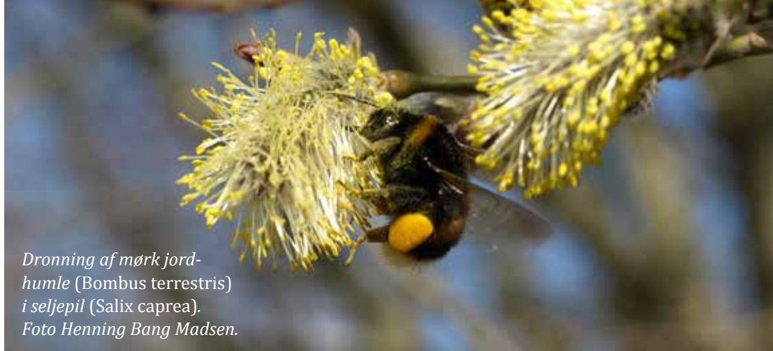
Dronning af mørk jord- humle (Bombus terrestris) i seljepil (Salix caprea).

medvirkende årsag til de store tab af honningbifamilier og til tilbagegangen for nogle af de øvrige biarter. Men for de vilde bier spiller mangel på egnede biotoper med såvel føde, som redepladser og materialer til redebygning sandsynligvis også en vigtig rolle.