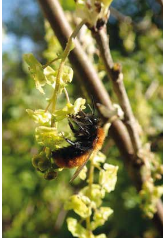
Figur 1. En mangfoldighed af bier: nogle vilde bier er meget iøjefaldende, f.eks. den flotte rød-pelsede jordbi ( Andrena fulva ) (foto t.v.), som om foråret besøger en lang række forskellige blomster Foto Yoko L. Dupont. Andre arter er mere uanseelige, f.eks. vejrbier, her bronzevejbi ( Halictus tumulorum ) (foto t.h.). Foto Henning Bang Madsen.