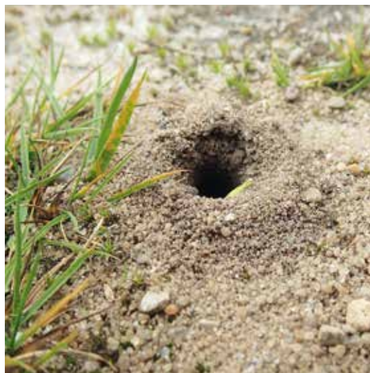
Figur 4. Redeindgang hos en jordboende bi, sandsynligvis en art af jordbi ( Andrena sp.).

Nogle enlige bier, særligt arter fra bugsamlerfamilien,