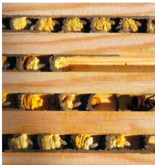
Figur 5. Reder af rød murerbi ( Osmia bicornis ) i et bihotel, hvor gangene er 8 mm brede. Hver yngelcelle indeholder bibrød (nektar og pollen) med et æg ovenpå. Cellerne afsluttes med en væg lavet af mudder og spyt. I anden gang nedefra sidder der en moderbi. Det er tydeligt at se de røde hår på bagsiden af underkroppen, som hun bruger til at transportere pollen.