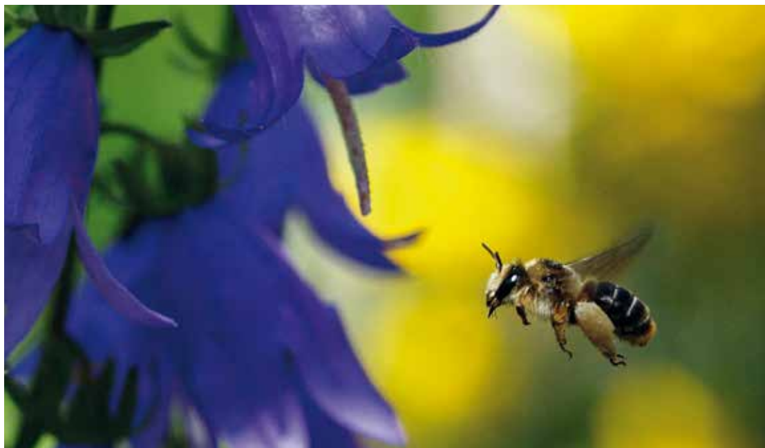
Figur 7. En hun af rødhålet høstbi ( Melitta haemorrhoidalis ), som er oligolektisk på klokkeblomster ( Campanula spp.).

Nogle bier er kræsne i forhold til pollen, som larverne udvikles på. Oligolektiske bier er specialister, som kun samler pollen fra en bestemt gruppe af planter, oftest en planteslægt eller –familie. En række arter, bl.a. mange arter af jordbier ( Andrena spp.) er oligolektiske på pil ( Salix spp.), og deres aktivitetsperiode er nøje synkroniseret med pilens blomstring (se figur 6). Men andre er oligolektiske på kurvblomster (f.eks. pragtbuksebi ( Dasypoda hirtipes )), klokkeblomster ( Campanula spp.) (f.eks. høstbi Melitta haemorrhoidalis (se figur 7)