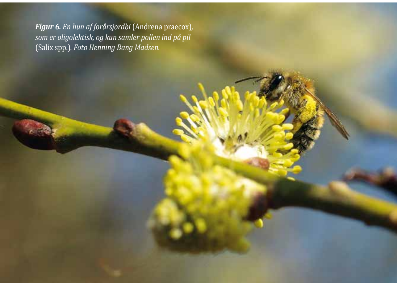
Figur 6. En hun af forårsjordbi (Andrena praecox), som er oligolektisk, og kun samler pollen ind på pil (Salix spp.).

En gruppe af bier bygger slet ikke reder, men udnytter andre redebyggende biers møjsommeligt indsamlede proviant. Redesnylteren (også kaldet en kleptoparasit) trænger ind i værtens rede, og lægger sit eget æg, som klækker til en larve, der æder værtens bibrød. Blandt humlebieerne findes snyltehumler, som er nært beslægtede med redebyggende humlebier, men som ikke selv bygger bo. Den parrede snyltehumlehun (pseudodronning) trænger ind hos den redeboende vært, fortrænger eller undertrykker den retmæssige dronning, lægger æg, og udnytter kolonien til at opfostre sit eget afkom. Den snyltende levevis er udviklet i flere forskellige familier af bier, og værterne findes