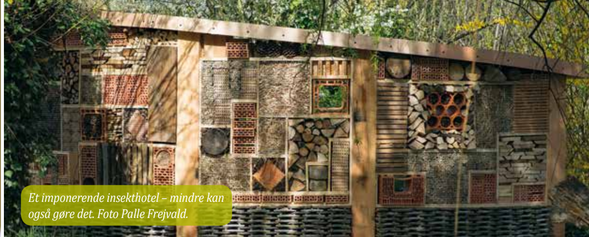
Et imponerende insekthotel – mindre kan også gøre det.