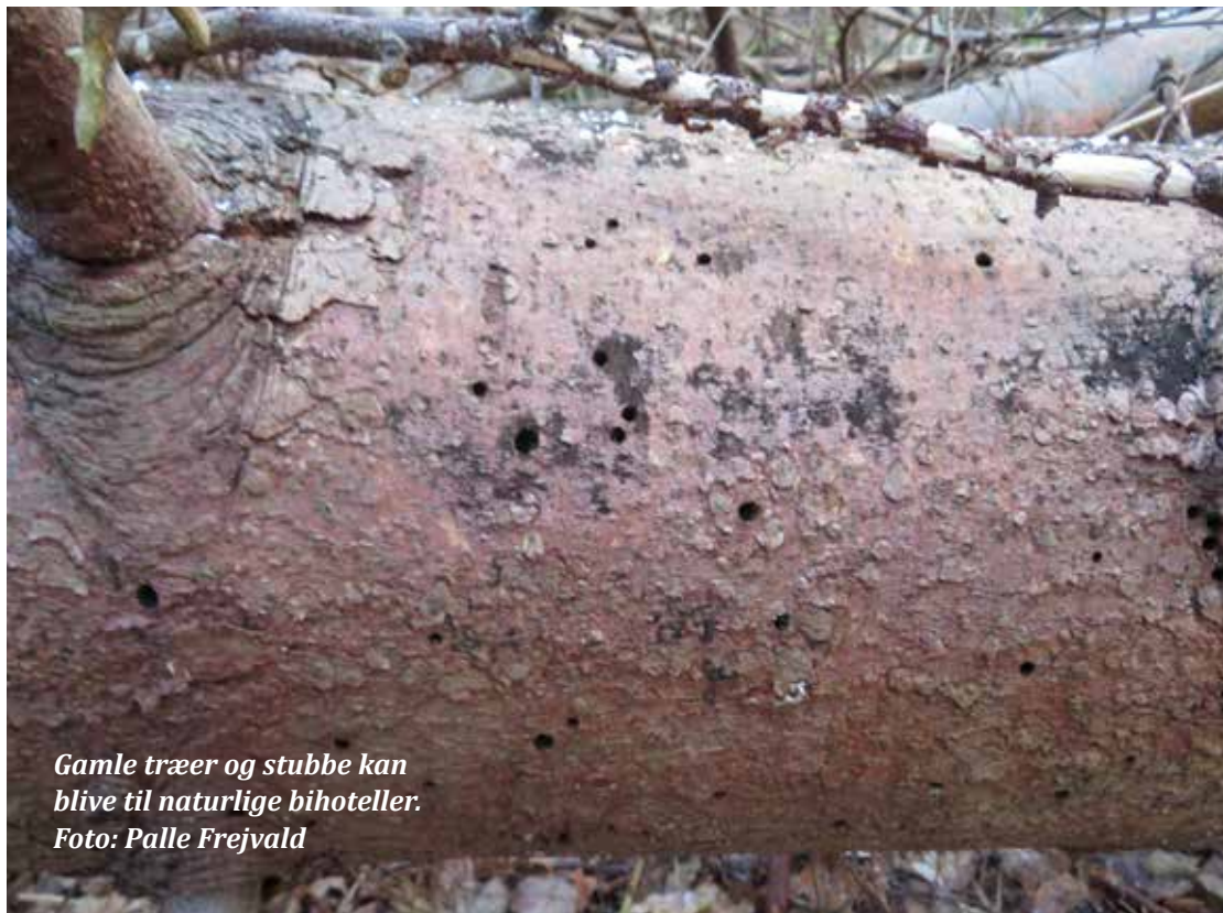
Gamle træer og stubbe kan blive til naturlige bihoteller.