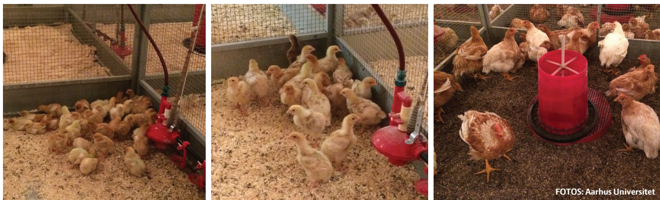
FIGUR 5: Fodringsforsøg med kyllinger (Projekt: Multiplant).