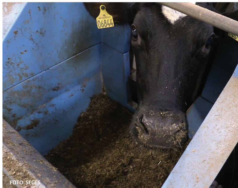
FIGUR 6: Fodringsforsøg med pressekage og almindelig græsensilage til malkekøer (Projekt BioValue).

Presseresten fra produktion af græsprotein har mange af de samme fodringmæssige egenskaber som græsensilage og dermed et stort potentiale for kvægbruget. De hidtidige resultater fra Aarhus Universitet vedrørende fodring med presserest er meget lovende, og køer, som fik ensilage af presserest, havde en højere mælkeproduktion end køer fodret med græsensilage. Presseresten ensilerede let og gav en ensilage med god ædelyst. Foderoptagelsen af den ensilerede presserest var højere end eller på højde med tilsvarende varenende græsensilage og presseresten havde en overraskende positiv effekt på mælkeydelsen. En mulig forklaring er at fordøjeligheden af presseresten er højere som følge af den fysiske behandling i presseprocessen. Resultatet fra forsøget (BioValue) er vist i tabel 9.