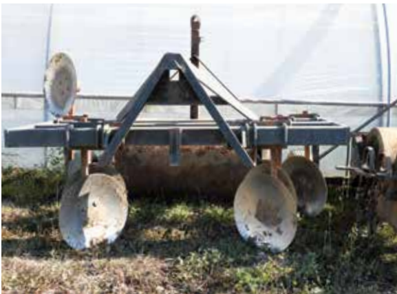
Das Häufelgerät wird benutzt, um Dämme zu formen.

«Die Themen der Kurse werden weitgehend durch die Landwirte der Interessengruppen unseres Netzwerks bestimmt. Anfänger sollen dabei ebenso angesprochen werden