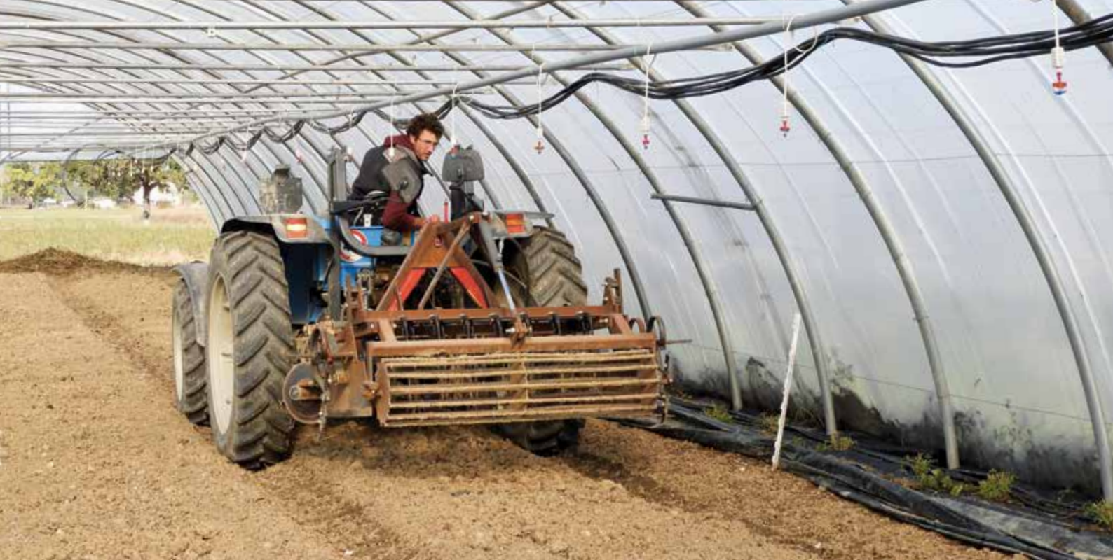
Der Dammanbau mit permanenten Fahrspuren benötigt oft Maschinen, die im Handel nicht zu finden sind.