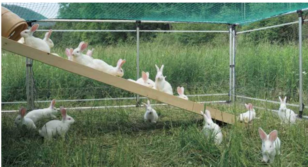
La rampe qui relie la lapinière et le pâturage a été rapidement et beaucoup utilisée par les lapins.

Chaque lapin a été pesé une fois par semaine et les consommations d'eau et d'aliments ont été mesurées et enregistrées de même que la température et l'humidité relative de la terre et la luminosité. La roulotte a fait ses preuves avec les conditions sèches et chaudes de cet été. Même lorsqu'il faisait très chaud, 32 °C à l'ombre dans la prairie, la température moyenne de l'intérieur se situait autour de 24 °C. La roulotte ne se refroidissait pas pendant la nuit grâce à sa bonne isolation. La luminosité minimale de 15 Lux exigée par l'Ordonnance de protection des animaux n'a pas toujours été atteinte à l'intérieur quand le temps était très couvert et pluvieux.