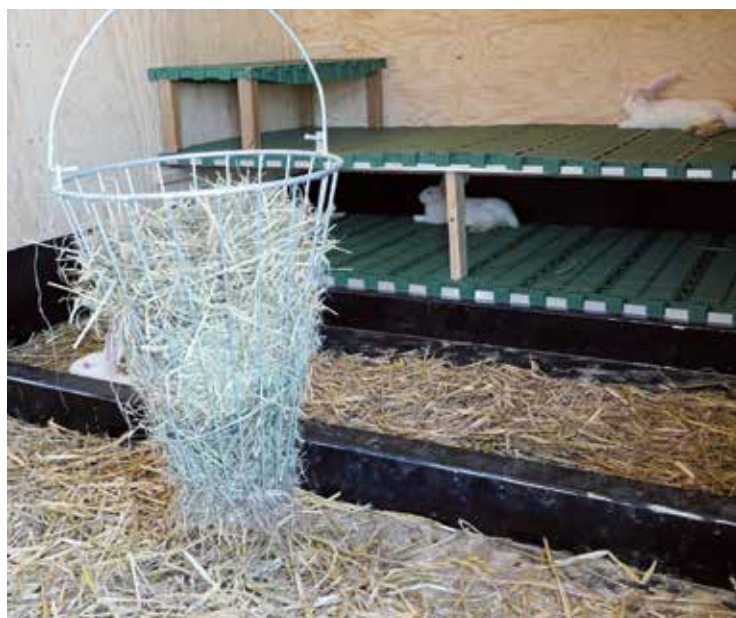
En été, les lapins apprécient la fraîcheur de la roulotte.