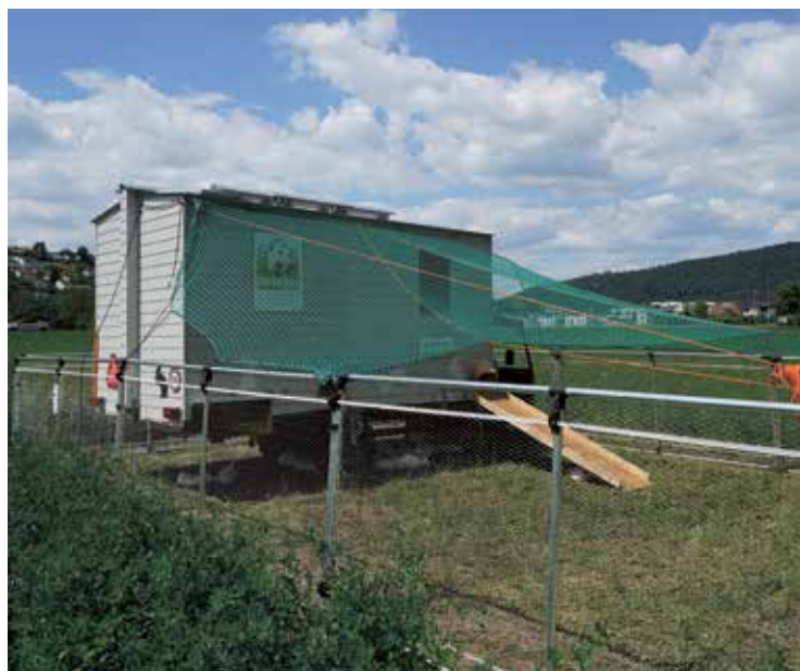
La roulotte a été déplacée une fois par semaine.

Kagfreiland va poursuivre ce projet l'année prochaine et les lapins pourront exercer leurs tours d'adresse jusqu'à ce qu'ils puissent un jour, qui sait, sortir du fameux chapeau magique. Anna Jenni, FiBL