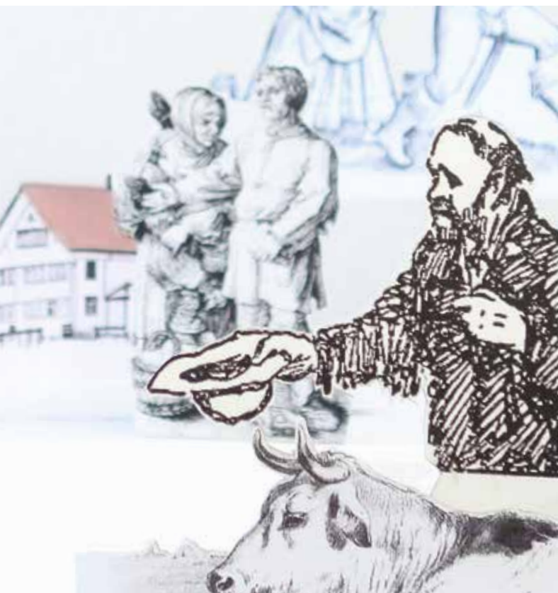
Illustrazione: Simone Bissig

Se il prezzo di un'azienda agricola è troppo alto per permettersela da soli, esiste la possibilità di un acquisto comunitario. Si presuppongono ovviamente una buona intesa e una visione comune fra i partecipanti. Ecco che il capitale necessario