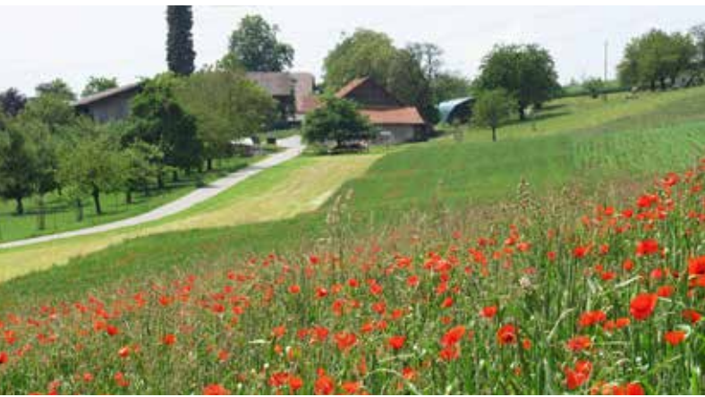
Figure 1 | La reconversion à l'agriculture biologique économiserait au moins 50% des produits phytosanitaires utilisés actuellement.

Renseignements: Lucius Tamm, e-mail: lucius.tamm@fibl.org