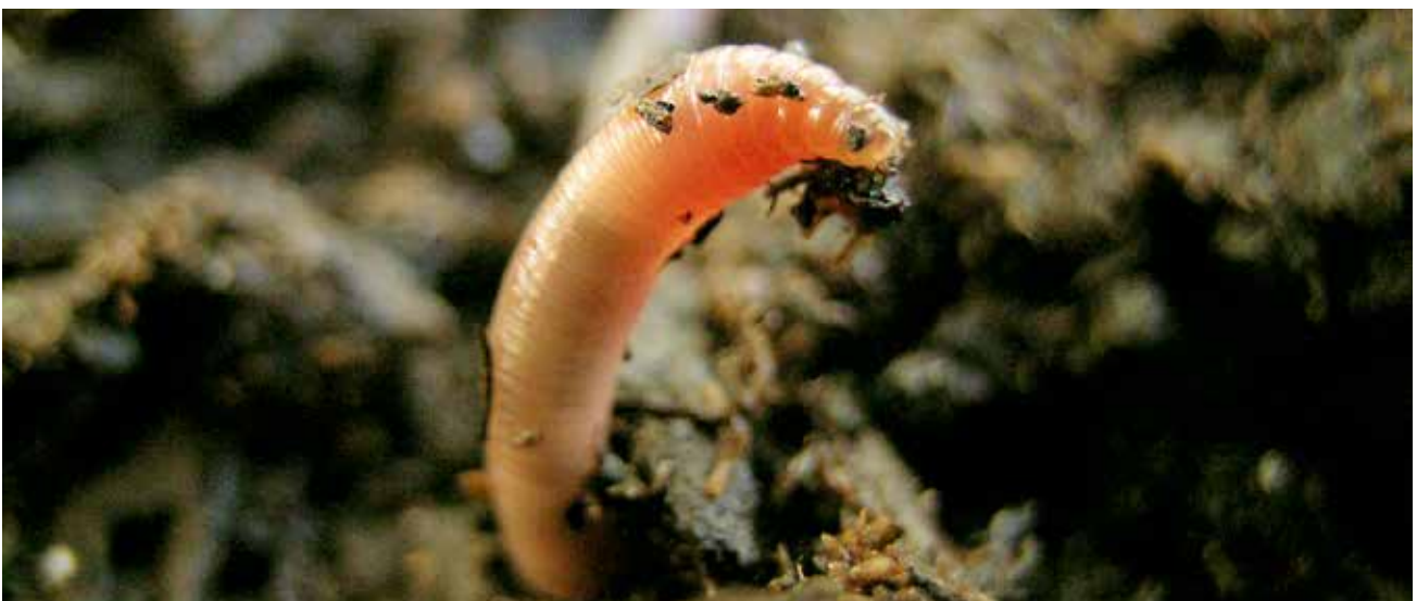
Les vers de terre aèrent les sols. Certaines espèces perforent même la semelle de labour.