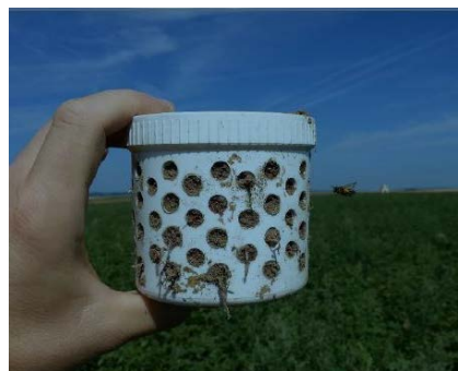
Abb. 1: Schematische Darstellungen einer Topf- und einer Tellerfalle sowie Abbildung einer Meles-Topffalle.