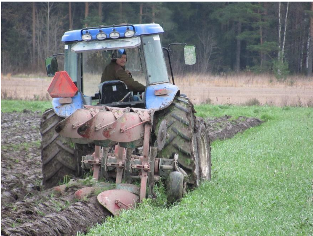
Kuva 12. Aluskasvin kyntöä syksyllä.

Aluskasvien tapauksessa niittoja ei voida käyttää samaan tapaan kuin kesannoissa, vaan rikkakasveja voidaan torjua niittäen vasta syksyn aikana, jolloin niittokertoja on selvästi vähemmän verrattuna koko vuoden kesantoon. Ruotsissa maataloilla tehdyissä kokeissa englanninraiheinä ja englanninraiheinän ja puna-apilan seos aluskasveina yhdistettynä kahteen sadonkorjuun jälkeiseen niittokertaan vähensivät juolavehnän juuriston ja versojen biomassaa syksyllä, mutta vaikutus seuraavan vuoden juolavehnän biomassaan oli vaihteleva (Ringselle ym. 2015). Yhteen kertaan tehdyllä niitolla ei ollut vaikutusta seuraavan vuoden juuristomäärään. Tähän saattaa vaikuttaa juuriston muita kasvinosia hitaampi reagointi muuttuviin oloihin (Aronsson ym. 2015). Ringsellen ym. (2015) mukaan niiton teho juolavehnän torjunnassa riippuu niittokertojen lisäksi myös niiton ajoituksesta, koska valon määrä ja lämpötila syksyllä vaikuttavat juolavehnän talvehtimiseen. Myös sillä kuinka paljon sadonkorjuu vahingoittaa juolavehnää on merkitystä.