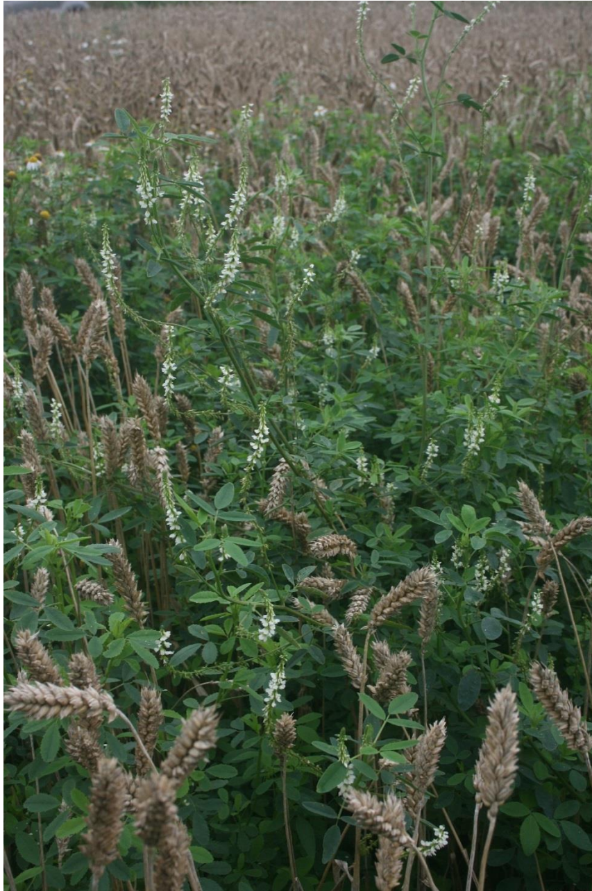
Kuva 10. Syysvehnäkasvustoon keväällä kylvetty valkomesikkä on kasvanut liian reheväksi vehnän seassa.

Osittain Valkaman ym. (2015) tuloksiin sisältyy myös esikasvivaikutusta, joka on palkokasveilla heiniä edullisempi (Känkänen & Eriksson 2007). Heinäkasvien mahdollinen epäedullinen jälkivaikutus seuraavan vuoden satoon liittyy niiden korkeaan hiili-typpeä -suhteeseen, sillä hiilipitoisen kasvimaan hajotukseen sitoutuu maassa vapaana olevaa typpeä. Aluskasvien jatkuvassa käytössä negatiivinen jälkivaikutus voi kuitenkin ajan mittaan hävitä (Ohlander ja Bergkvist 1996).