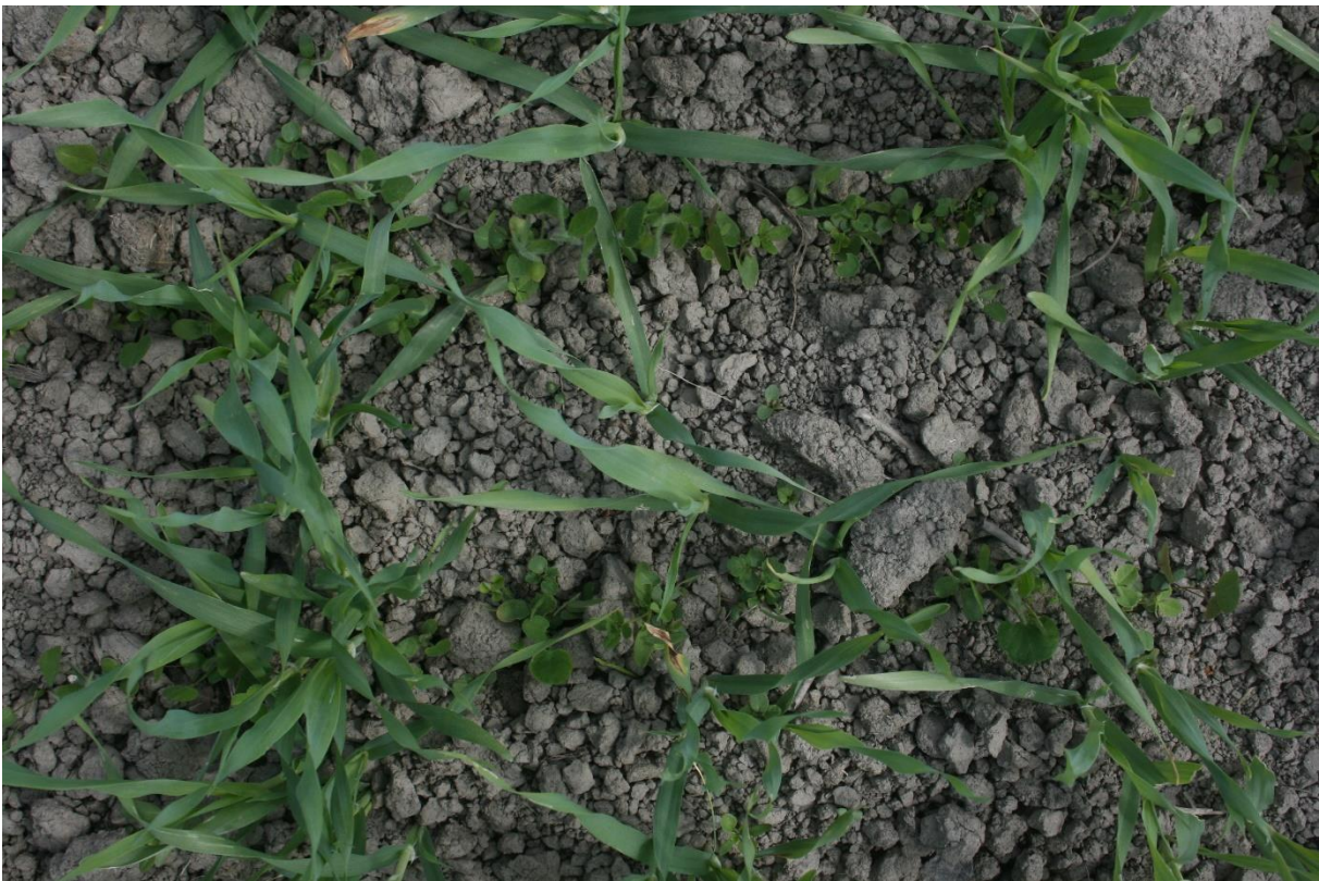
Kuva 8. Ohran oraat ovat saaneet hyvän etumatkan peitekasvien taimista.