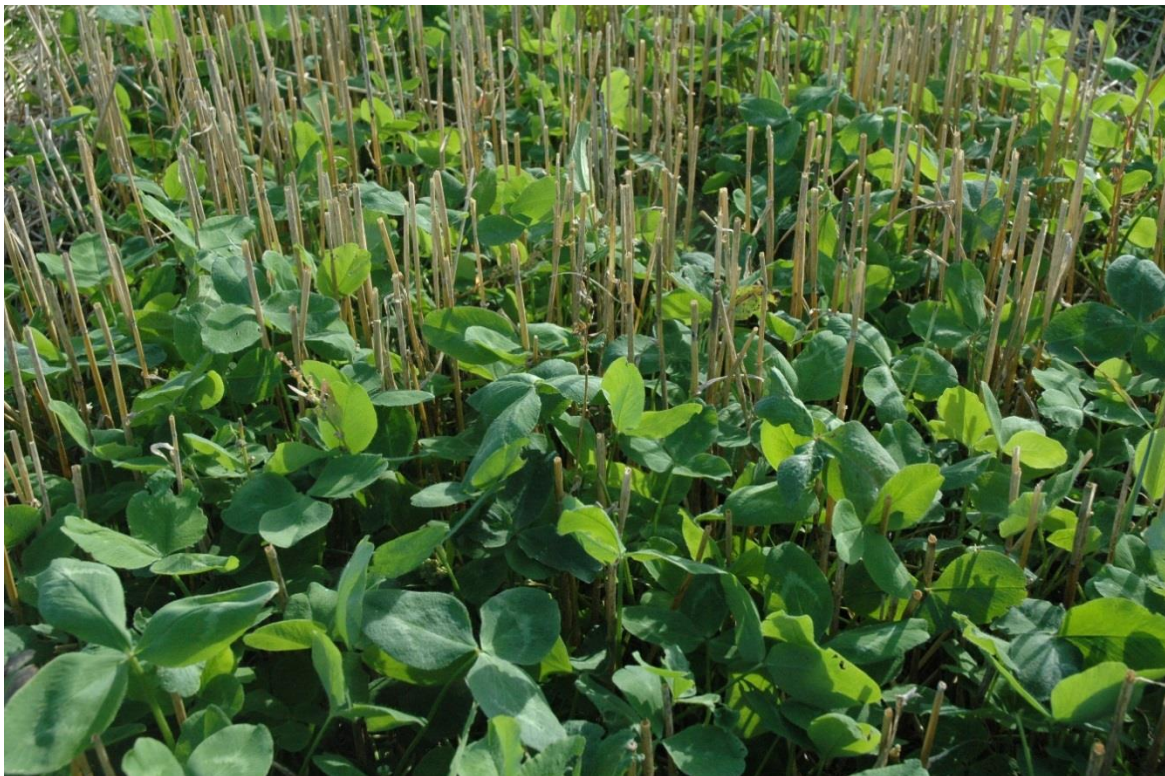
Kuva 4. Ohran aluskasvina kasvanut puna-apila 31.8.2016, Mustiala, Ravinneresurssi.