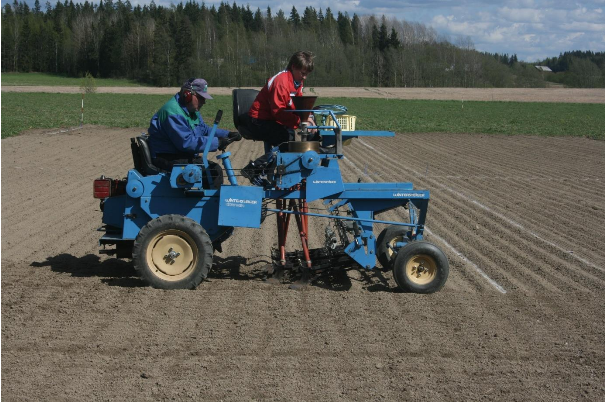
Kuva 7. Peitekasvin voi kylvää jo toukokuussa, jos luottaa, että satokasviksi kylvetty kevätilja pärjää kilpailussa peitekasvia vastaan. Kuvan koekentällä Jokioisten savimaalla peitekasvit kylvettiin poikittain ohrariveihin nähdän vuorokausi ohran kylvön jälkeen.