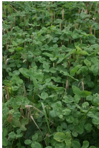
Kuva 15. Peitekasvit jatkavat nopeasti kasvuaan, jos viljan korsi silputaan hyvin.