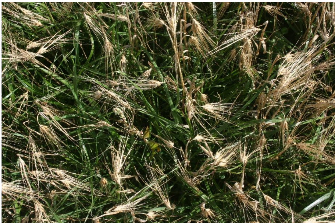
Kuva 2. Italianraiheinä voi riehaantua ohran seassa: Kuva Jukka Salonen.

Italianraiheinä soveltuu aluskasviksi, koska se taimettuu melko varmasti ja kasvaa pitkälle syksyyn asti. Sitä käytetään myös yleisesti Suomessa aluskasvina. Känkänen ja Eriksson (2007) raportoivat italianraiheinän maanpäälliseksi kuiva-ainesadoksi ohran ( Hordeum vulgare ) aluskasvina keskimäärin 1 400 kg/ha, kun muiden heinien vastaava sato oli ainoastaan 400 – 600 kg/ha. Italianraiheinä on monivuotinen heinäkasvi, mutta se talvehtii pohjoisissa oloissa huonosti. Mikäli se kuolee syksyn tai talven aikana, siitä ei tule rikkakasvia seuraavaksi vuodeksi. Etelä-Suomessa saatujen viljelijäkemusten mukaan italianraiheinä voi kuitenkin talvehtia suotuisissa olosuhteissa, jolloin seuraavan vuoden kilpailuvaikutus voi aiheuttaa suuria satotappioita (Koppelmäki & Känkänen 2014). Talvehtimisessä on ilmeisesti lajike-eroja, mutta asiaa ei ole aluskasvikäytön näkökulmasta tutkittu. Ruotsissa tutkittiin italianraiheinän kevätkylvöä syysohnan aluskasviksi, jolloin se tuotti noin 1 100 kg/ha suuruisen kuiva-ainesadon (Olsen 1995).