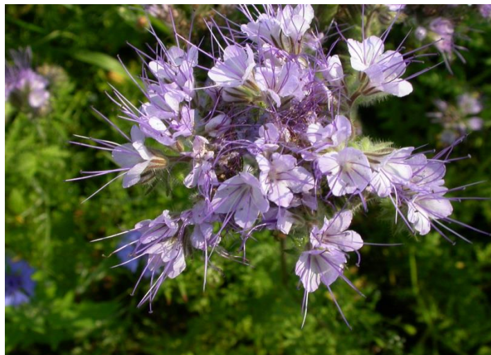
Kuva 14. Hunajakukkaa on kokeiltu kerääjäkasviksi sadonkorjuun jälkeen, mutta sen kasvuunlähtö on hidasta.