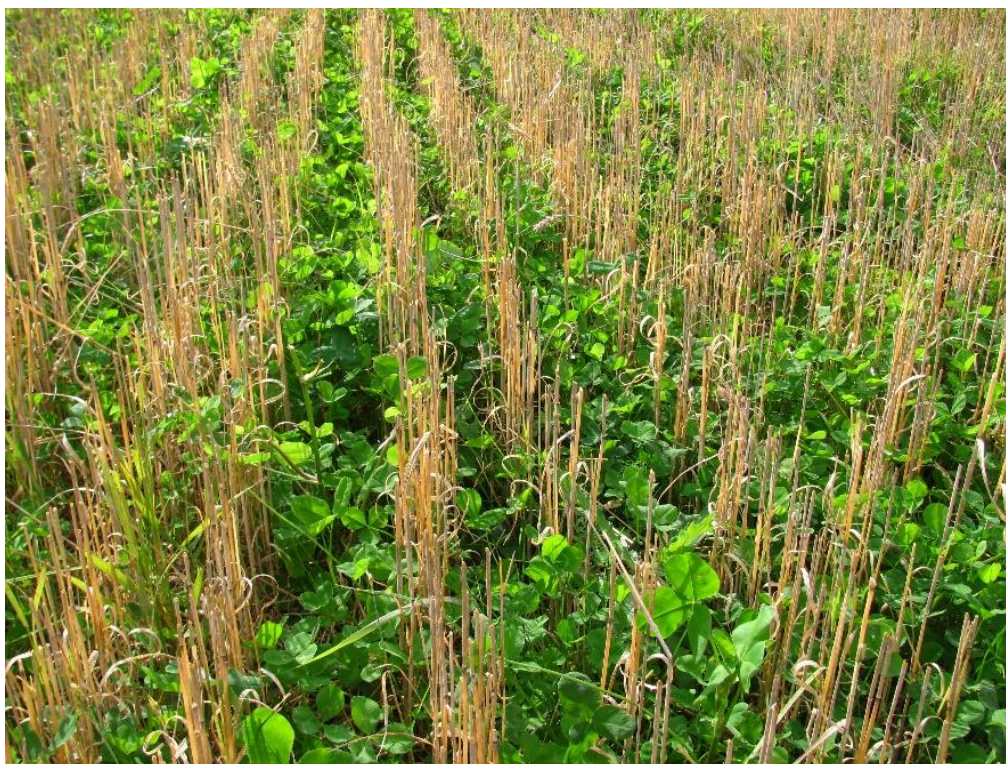
Kuva 5. Valkoapilan ja italianraiheinän seos kevätvehnän puinnin jälkeen.

Tanskassa pitkäkestoisessa luomuviljelykiertokokeessa puna-apilaa ja valkoapilaa sisältävät aluskasviseokset yhdessä englanninraiheinän kanssa tuottivat suuremman biomassan kuin englanninraiheinän, nurmimailasen, keltamaiteen ( Lotus corniculatus ), peltolinnunjalan ( Ornithopus sativus ) ja maa-apilan seokseen (Doltra & Olesen 2013).