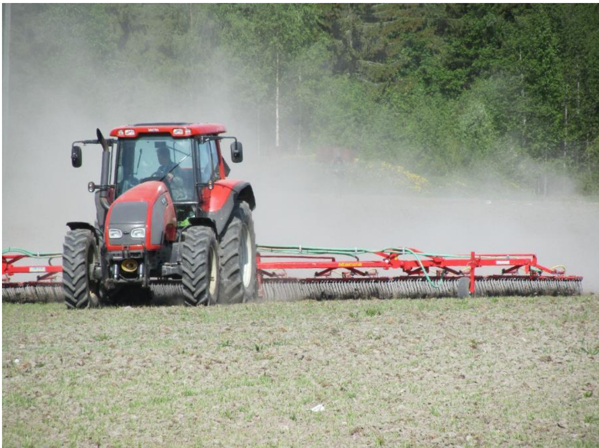
Kuva 9. Aluskasvi voidaan kylvää myös rikkakasviäestyksen yhteydessä.

Kun aluskasvi kylvetään rikkaaestyksen yhteydessä, sen kilpailuvaikutus satokasvia vastaan pienenee. Rikkaaestyksen yhteydessä tehty kylvö voidaan tehdä joko ennen satokasvin orastumista niin sanotun sokkoäestyksen yhteydessä tai myöhemmin kun satokasvi on jo taimettunut. Rikkaaestys multaa aluskasvin siemenen kevyesti, mikä edesauttaa taimettumista verrattuna pintakylvöön. Maan muokkaaminen myös idättää uusia rikkakasveja, mistä johtuen rikkaaestyksen ajoitus on onnistumisen kannalta tärkeää. Liian myöhään tehty äestys ei myöskään tehoa rikkakasveihin.