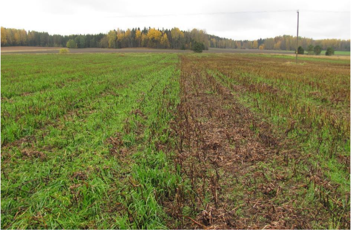
Kuva 3. Härkäpavun aluskasviksi kylvetty italianraiheinä kuva vasemmassa reunassa ja timotei oikeassa reunassa.

Westerwoldinraiheinä ( Lolium multiflorum subsp. westerwoldicum ) on nopea- ja vahvakasvuinen yksivuotinen heinä, jota käytetään aikaisin korjattavien vihannesten ja perunan jälkeen kerääjäkasvina (Aronsson 2012). Aidosti yksivuotisena kasvina westerwoldinraiheinä kuolee talven aikana, jolloin sen lopettamisesta ei tarvitse huolehtia. Viljan aluskasviksi kylvettynä se saattaa ehtiä tehdä siemeniä ennen puintia. Nopean kasvun johdosta se kilpailee aluskasviksi kylvettynä viljan kanssa voimakkaasti, mutta puinnin jälkeen kasvu on melko heikkoa (Känkänen ym. 2001a, Känkänen ja Eriksson 2007).