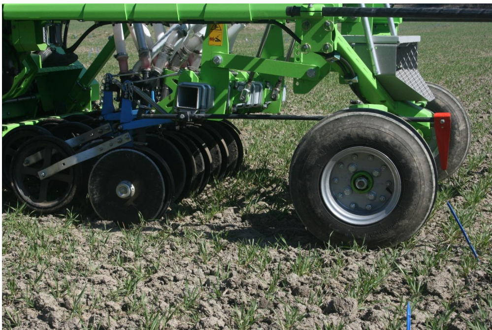
Kuva 13. Peitekasveja kannattaa kokeilla myös syysviljan sänkeen keväällä kylvettynä.

Bergkvistin ym. (2010) mukaan juolavehnan juuriston määrää voi vähentyä vähäisenkin punanatakasvuston avulla, jolloin riski sadon alenemiseen on pienempi. Vaikutus syysvehnan satoon riippuu punanadan kasvukunnosta talvehtimisen jälkeen. Punanadan talvehtiessä hyvin sen alkukasvukauden kasvu on nopeampaa, jolloin se vähentää rikkakasvien kasvua enemmän, mutta vähentää myös satokasvin satoa. Aluskasvikäytössä punanata voi vaatia toimenpiteitä, joilla sen liian nopeaa kasvua rajoitetaan keväällä. Ruotsissa Olsen (1995) havaitsi syksyllä kylvetyn punanadan ja englanninraiheinän vähentävän syysviljan satoa merkittävästi, kun taas keväällä kylvetyllä puna-apilalla tai italianraiheinällä ei ollut vaikutusta satoon. Samansuuntaisen tuloksen havaitsivat Bergkvist ym. (2011) kokeessa, jossa syysvehnään keväällä kylvetyllä aluskasvilla ei ollut merkittävä vaikutusta vehnän satoon.