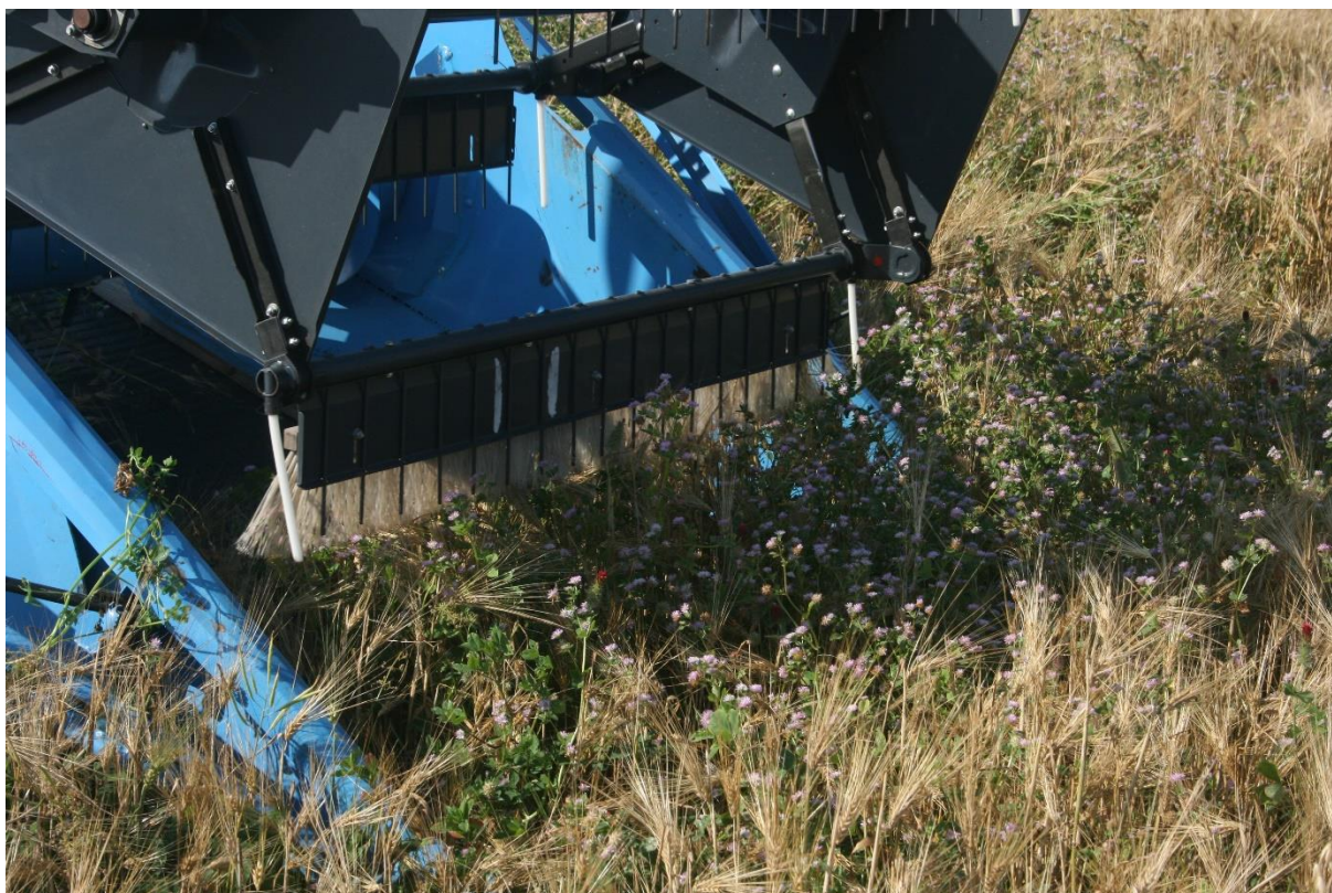
Kuva 11. Rehevä persianapila tuottaa hyvin tyyppiä, mutta voi vaikeuttaa puintia.

Tanskassa pitkäkestoisessa kenttäkokeessa aluskasvien käyttö johti suurempaan rikkakasvien runsastumiseen verrattuna aluskasvittomiin sänkimuokattuihin aloihin (Olesen ym. 2007, Rasmussen ym. 2014). Tutkimuksessa käytettiin useita eri aluskasveja. Doltran ja Olesenin (2013) mukaan luomukauran satoja voidaan lisätä sisällyttämällä sopivat aluskasvit viljelykiertoon. Tutkimuksessa saatiin viitteitä pitkäaikaisen aluskasvien käytön hyödyistä maan viljavuudelle. Todisteita pitkäaikais- hyödyistä on saatu myös Norjassa, missä neljän vuoden perättäinen puna-apilan tai valkoapilan käyttö aluskasvina lisäsi kevätiljojen jyväsatoa noin 30 % (Løes ym. 2011).