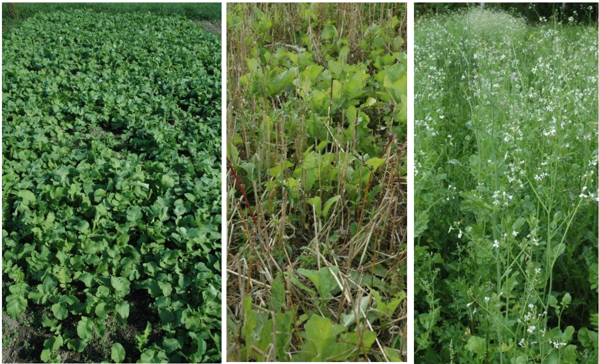
Kuva 6. Öljyretikka kasvaa vahvasti, jos se kylvetään riittävän aikaisin ja sillä on ravinteita käytettävissään. Vasemmalla: Kylvetty 3.8.2016 muokattuun maahan virnan jälkeen, kuvattu 7.9. Keskellä: Kylvetty 12.8.2016 ohran sänkeen, kuvattu 23.9. Oikealla: Kylvetty alkukesällä 2016, kuvattu vajaan kahden kuukauden kuluttua.