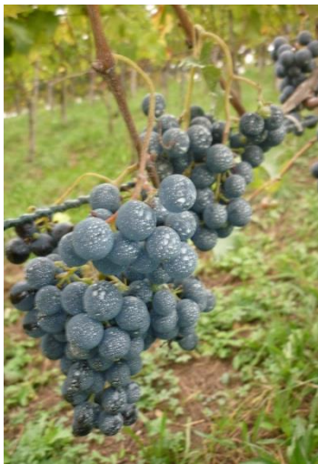
Klinospray + Heliosol