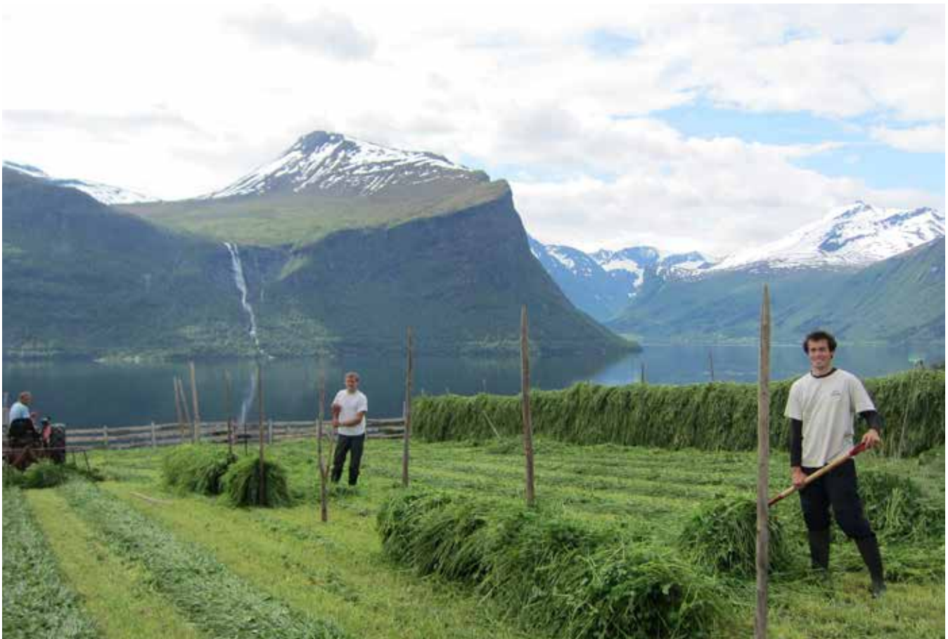
Bruk av lokalkunnskap, fleksible løsninger, naboarbeid og sosiale nettverk var viktige tilpasninger for å håndtere den nedbørrike sommeren 2011 i Rauma. Noen bønder valgte å hesje for å berge grasavlingene.

beid, sosiale nettverk, fleksibilitet og mangfold. Samfunnsendringer og strukturendringer i landbruket kan påvirke disse nøkkelpunktene og redusere bøndenes tilpasningsevne.