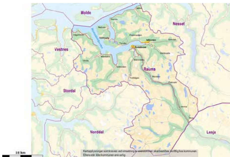
Figur 2 Høye fjell og trange fjorder skaper store kontraster i lokalklima. Rauma kommune har både kyst- og innlandsklima. Lengden av vekstsesong, gjennomsnittsnedbør og temperatur blir påvirket av områdets avstand til og høyde over havet. Klimaendringer vil påvirke de forskjellige områdene ulikt.