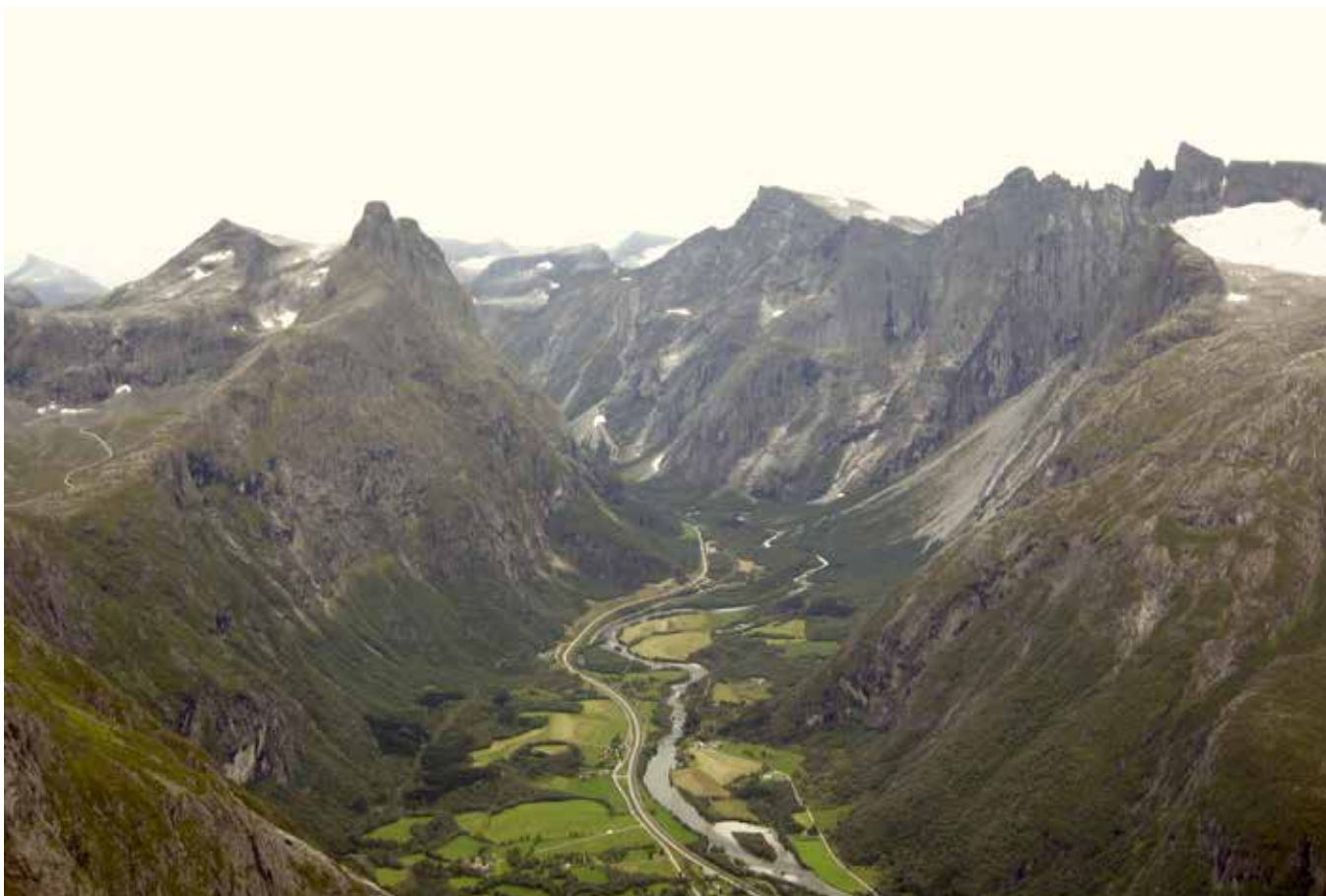
Jordbruk i nedre del av Romsdal.

endringsprosesser uavhengig av hverandre. Ved å inkludere ikke-klimatiske faktorer i analysen, søkte studien å øke kunnskapen om hvordan bønder tilpasser seg en kombinasjon av endringer, få et mer nyansert bilde av sårbarhet og tilpasning på gardsnivå og øke forståelsen for hvordan dagens tilpasninger kan påvirke fremtidig drift, tilpasning og sårbarhet.