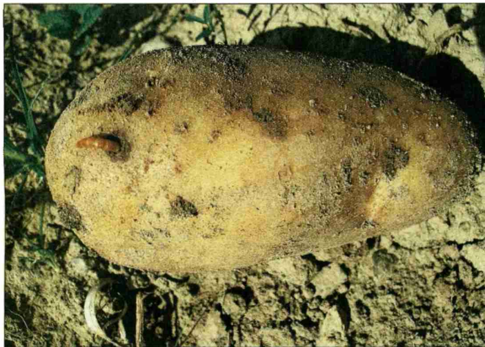
Der Drahtwurm ist ein robustes Wesen.