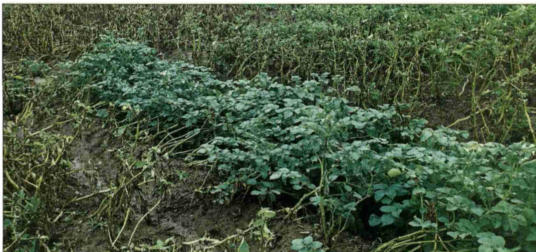
Grosse Unterschiede: Die gegen Krautfäule resistente Sorte Vitabella und ihre anfälligen Nachbarinnen.