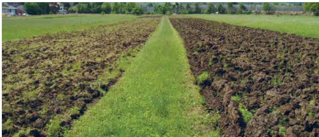
Der Bodenbearbeitungsversuch in Frick kurz vor der Maissaat im Jahr 2015 (FiBL). Linke Bildhälfte: Reduziert bearbeitet mit Resten der vorigen Gründüngung an der Bodenoberfläche. Rechts: Gepflügt.

Auf der Ebene der Mikroorganismen wiesen reduziert bearbeitete Böden in den ersten zehn Zentimetern nach rund zehn Jahren eine um bis zu 46 Prozent höhere mikrobielle Biomasse (Bakterien, Pilze, Protozoen) im Vergleich zum Pflugverfahren auf (Gadermaier et al. 2012, Kuntz et al. 2013). Dabei verschob sich die mikrobielle Zusammensetzung in Richtung der Pilze (Kuntz et al. 2013). Untersuchungen im Rahmen des Projektes TILMAN-ORG an mehreren Standorten in Europa lassen ebenfalls den Schluss zu, dass die Bodenbearbeitung einen deutlichen Einfluss auf die genetische und strukturelle Zusammensetzung der Mikroorganismenpopulationen in der obersten Bodenschicht ausübt (Fliessbach et al. 2014).