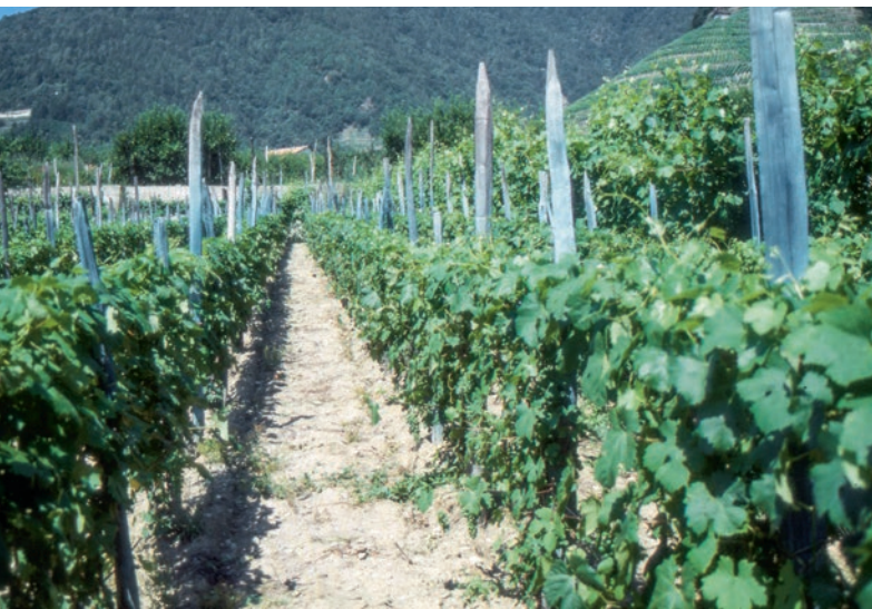
Figure 1 | Dans ce vignoble, le dépôt bleu sur les échelas témoigne d'une utilisation de quantités élevées de cuivre depuis des décennies (photo datant de 1989).

Renseignements: Bernhard Speiser, e-mail: bernhard.speiser@fibl.org