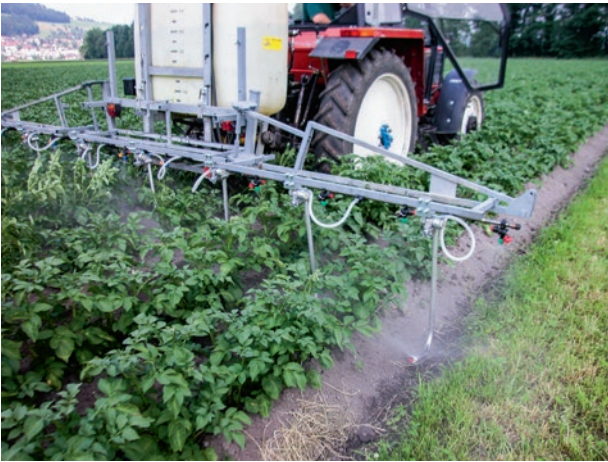
Figure 2 | Une application sous les feuilles des produits phytosanitaires permet une meilleure pulvérisation à la surface inférieure du limbe. Dans les cultures de pommes de terre, cette technique ne convient que jusqu'à la fermeture des rangs. Par la suite, les «Droplegs» s'empêtreraient dans les plants et les endommageraient.

tantes, de sorte que la quantité moyenne de cuivre utilisée a dû être extrapolée. Les quantités de cuivre appliquées, déterminées pour l'agriculture biologique suisse, sont du même ordre de grandeur que les quantités utilisées par les paysans bio allemands. Les agriculteurs interrogés lors des enquêtes les plus récentes des associations agricoles allemandes utilisent environ 1 à 2 kg/ha/an selon les cultures (Kanthak et al. 2014).