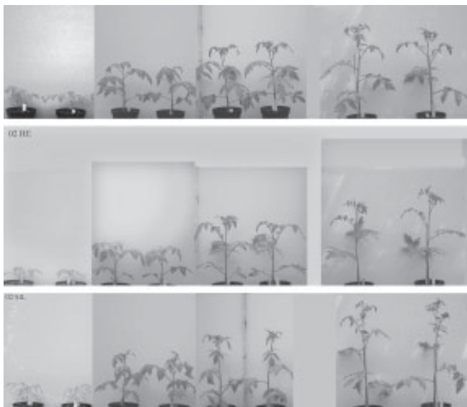
Abb.1: Je zwei Pflanzen der nicht manipulierte Kontrolle GCR 161 (oben), der Variante mit hoher Expression (HE, Mitte) und der Variante mit stillgelegtem Fremdgen (Sil, unten), ca. alle 10 Tage fotografiert. Die Kontrollpflanzen sind in der Jungpflanzenentwicklung schneller und haben mehr Blattmasse bei ausladender Wuchsform. Ab Juni bilden die Sil-Pflanzen längere Internodien und kleinere Blätter als die beiden anderen Varianten.