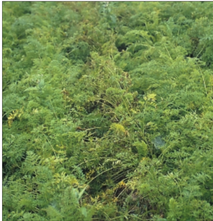
Abb. 1. Standort Basadingen: Besonders die Sorte Roxette (Bildmitte) ist mit starkem Alternariabefall aufgefallen.

Karotten sind im Bioanbau sowohl für Gemüseanbauer als auch als «Hackfrucht» im Feldanbau eine wichtige Kultur. In allen Verkaufsstatistiken erscheint die Karotte immer als das Gemüse mit dem grössten Bioanteil. Um die wichtige Position der Inland-Karotte zu halten, muss zur Produktionsoptimierung der Handarbeitseinsatz für die Unkrautbekämpfung tief gehalten und Lagerverluste minimiert werden, und das Produkt muss auch geschmacklich überzeugen. In den Sortenversuchen, die wir 2002 durchgeführt haben, stand darum neben der Krankheitstoleranz gegenüber Alternaria -Blattflecken der Geschmack im Vordergrund. Neben Degustationen bietet sich «°Brix» als einfach zu messender «Geschmacksparameter» an, mit dem der Zucker-