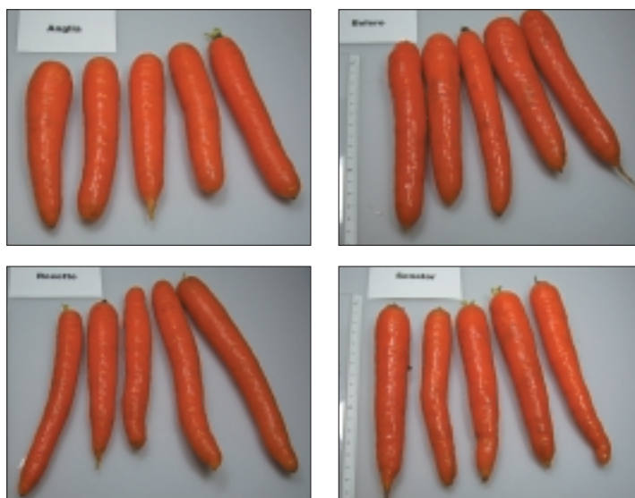
Fig. 3. Anglia et Senator étaient de forme et de taille régulières, alors que les carottes Bolero étaient parfois surdimensionnées. Les carottes de la variété Roxette étaient trop longues et trop minces.

Dans la production en mode biologique, la carotte occupe une place importante aussi bien dans la production maraîchère que dans les grandes cultures, en tant que «culture sarclée». Dans toutes les statistiques de vente, la carotte est le légume le plus cultivé selon les méthodes de production biologique. Pour garder à la carotte indigène sa position prépondérante, il faut, d'une part, veiller à en optimiser la production en limitant la charge de travail manuel dans la lutte contre les adventices et en réduisant le plus possible les pertes durant le stockage; d'autre part, le produit doit convaincre par ses qualités gustatives. Dans nos essais variétaux de 2002, nous nous sommes intéressés non