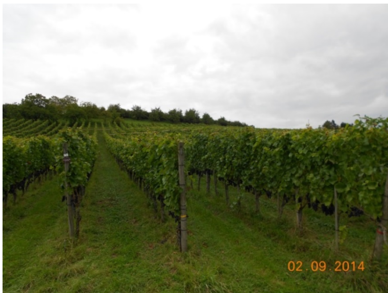
Abbildung 1: Versuchsfläche Rebberg

Die Versuche wurden an Reben der Sorte Blauburgunder im FiBL-Rebberg Frick durchgeführt (Abbildung). Die fünf verschiedenen Verfahren wurden jeweils in fünf Reihen Blauburgunder appliziert (Abbildung 2). Die Reihenlänge betrug ca. 110 m. Das mittlere Drittel der Reihen blieb als Kontrolle unbehandelt. Der Versuch wurde als Tastversuch ohne echte Wiederholungen angelegt.