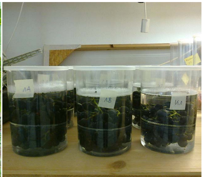
Abbildung 4: Traubenproben in Seifenwasser