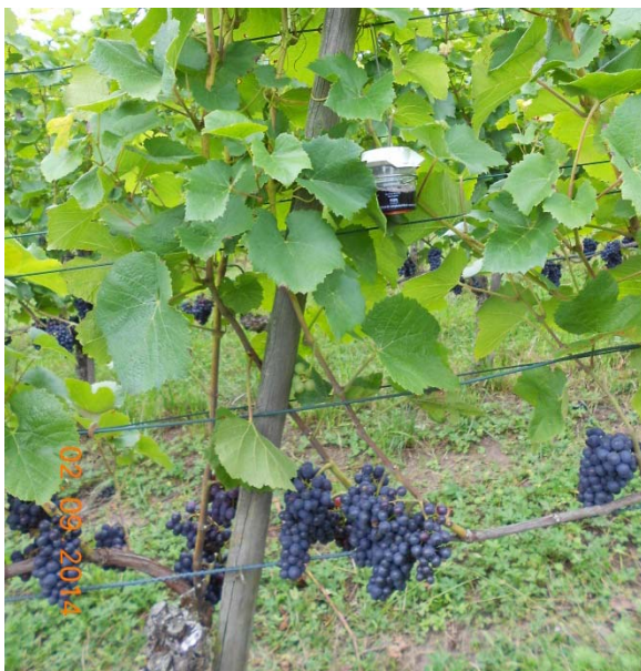
Abbildung 3: Monitoringfalle für D. suzukii

Am 22.09.2014 wurde eine visuelle Schätzung des prozentualen Anteils von Essigbeeren und Beeren mit Befall durch Botrytis cinerea in der Mittelreihe eines jeden Verfahrens vorgenommen. Dort wurden auch die Proben der Weintrauben genommen: ca. 12 kleine Ästchen mit gesunden Trauben wurden abgeschnitten. Diese Beeren wurden unter dem Binokular auf Eiablage kontrolliert. Danach wurden 100 Beeren abgezählt und für 24 h in einen Plastikbehälter gelegt, damit die Larven aus allfällig vorhandenen Eiern Zeit hatten zu schlüpfen. Anschliessend wurden die Trauben mit Seifenwasser bedeckt (Abbildung 4) und nach weiteren 24 h wurden die am Boden schwimmenden Maden gezählt (Methode Agroscope, Baroffio 2014).