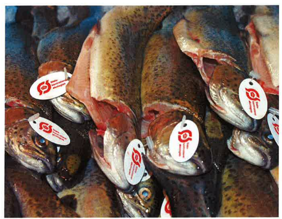
Kun en lille del heraf produceres økologisk, men mængden er stigende.

have nogen tydelig effekt, hverken på tarmfloraens sammensætning i fisken eller i forbindelse med smitteforsøg med bakterielle fiskepatogener. Da probiotikaet er tilsat som standard i diættype A (det kommercielle yngelfoder Inicio Plus), blev det tilsat alle diæter i foderforsøg II.