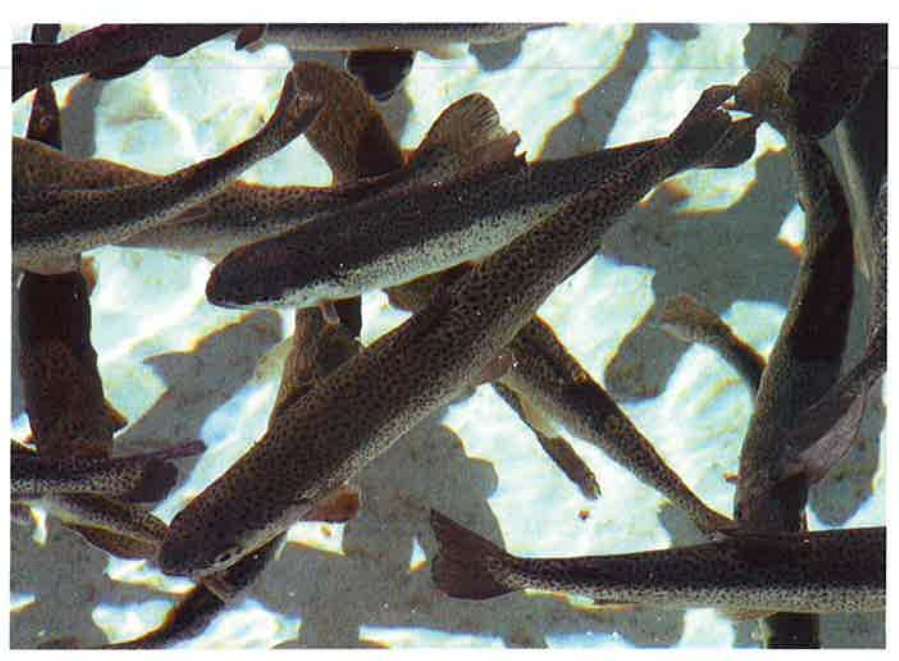
OPTIFISH projektet har vist, at det betyder mere for fiskens tarmflora, hvilken type ingredienser, der er i foderet, end hvorvidt foderet er af økologisk eller konventionel oprindelse.

De fleste undersøgelser i projektet er baseret på prøver taget under to store foderforsøg, hvor grupper af regnbueørreder er blevet fodret med forskellige fodertyper fra foderstart til fiskene har opnået en vægt på ca. 8 g. I foderforsøg I blev konventionelle marine fodertyper sammenholdt med vegetabilske diæter indeholdende både rapsolie og ærteprotein. Vegetabilske diæter viste sig at have en positiv effekt på sammensætningen af den bakterielle tarmflora (en højere forekomst af mælkesyre-bakterier) hos fiskene i forsøget, men det kunne ikke afgøres, om det skyldtes rapsolieeller ærteprotein-tilsætningen. Derfor var de afprøvede diæter i foderforsøg II enten tilsat rapsolie, ærteprotein eller begge dele (tabel 1). Det anvendte probiotikum, der er godkendt som tilsætning til fiskefoder, fra første forsøgsrunde så i den afprøvede dosering og forsøgsopsætning ikke ud til at