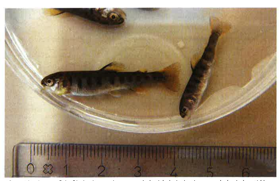
I fremtiden kan en fisk således kun sælges som økologisk, hvis den igennem hele sin levetid har levet under økologiske forhold og har fået godkendt økologisk foder.