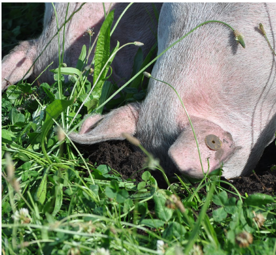
Kløvergræs og jordskokker kan bidrage væsentligt til slagtesvins forsyning med energi, protein samt mineraler og vitaminer, og at der kan opnås en høj kødprocent ved slagtesvin på friland.

I projektet blev der fundet forskelle mellem afstamninger for immunfunktioner. Afstamningen med det laveste vækstpotentiale (SU51) ser ud til at have flere monocytter og lymfocytter samt antistoffer end afstamningen med det største vækstpotentiale (JA757) – og forskellen var især tydelig når JA757 havde en høj foderoptagelse og væksthastighed. Dette stemmer overens med hypotesen om, at lavere vækstrate giver mulighed for at udvikle et mere robust immunsystem.