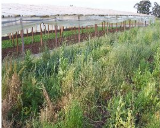
Foto 1: Ambiente semi-natural adyacente a la parcela de cultivo, en una de las fincas consideradas- La Plata-Argentina.

pertenecientes a las familias consideradas ecológicamente importantes por su rol como hospederas de enemigos naturales (ALTIERI y LETOURNEAU, 1984; SAINI y POLACK, 2002). Para el análisis estadístico se tuvieron en cuenta las siguientes variables por ambiente: riqueza específica; riqueza de familias; riqueza de géneros; número de especies pertenecientes a las familias Apiaceae (Ap), Fabaceae (Fb) y Asteraceae (As); número de las familias ecológicamente importantes en cada ambiente (Fb, Ap, As) y número de estratos verticales. Para el cálculo de esta última variable, se establecieron 7 estratos vegetales, con un rango de 0,25 m. cada uno, en base a la bibliografía de la vegetación de la zona (MARZOCA, 1976; CABRERA y ZARDINI, 1979).