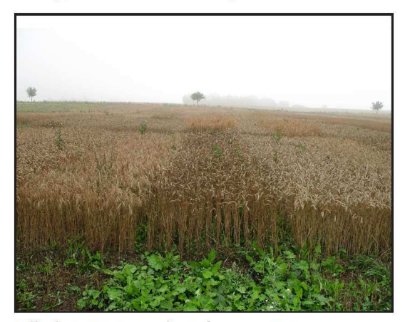
Billede 1. Vintersæd artsforsøg 2007.

Sorterne der er anvendt fremgår af tabel 1. Jordtypen er JB 6. Forfrugten var hvidkløver.