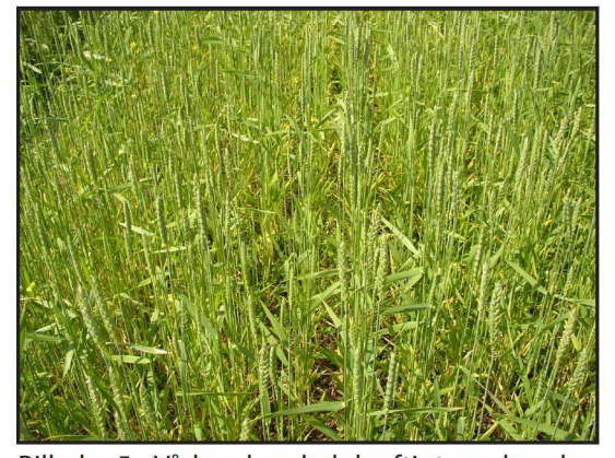
Billede 5. Vårhveden led kraftigt under den manglende tilførsel af gødning.

I begge vinterhvedesorter har gødskning medført en højere rumvægt. Proteinindholdet ligger relativt lavt. Der er dog et klart højere proteinindhold i den gødede del af parcellen. Der