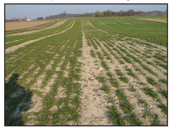
Billede 2. Vinterhvede Ellvis sået 18. oktober.

Konklussionen på første år var, at med de anvendte priser på omkring 135 kr. pr. hkg. for foderkorn, var det rentablet at anvende gødning. Det samlede dækningsbidrag for 2006 blev således på ca. 4.400 kr/ha i gennemsnit