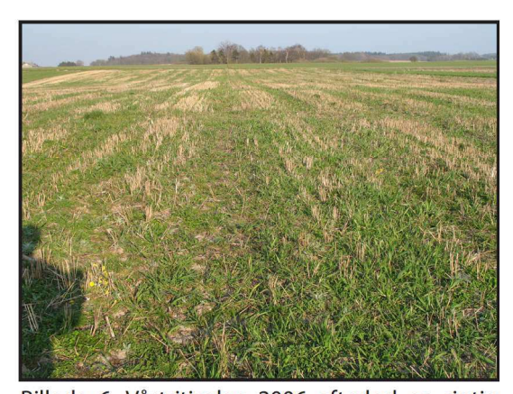
Billede 6. Vårtriticalen 2006 efterlod en rigtig god kløverefterafgrøder.

Vårtriticale har skuffet i forhold til vårbyggen. Det er lidt overraskende da den normalt giver et højere udbytte. Den har kvitteret godt for tildeling af gødning. Uden gødning var udbyttet sølle 11,9 hkg/ha mens en tildeling af gylle fordoblede udbyttet. Proteinindholdet blev også væsentligt forbedret, ligesom rumvægten er steget med næsten 3 kg/hl.