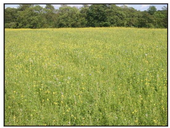
Billede 3. Lupiner etableret og fremspiret dårligt på areal med højt ukrudtstryk i form af agerkål er dømt til at mislykkes.

Vårhvederne, Vinjett, Taifun og AC Vista blev sået den 18. april. Der er tilstræbt et plantetal på 450 pl./m² ved 12 cm rækkeafstand. Ved 24 cm rækkeafstand er sået 225 pl/m². Fremspiringen var uensartet. Angreb af sorte fugle har reduceret plantebestanden betragteligt. Forfrugten var lupin og hestebønne. Arealet blev stubharvet i efteråret 2006. Der er striglet