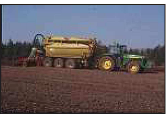
Billede 1. Med de meget store gyllevogne der anvendes, er der meget stor risiko for uoprettelige strukturskader. Det gælder især ved nedfældning.

83 kr/ton konventionel svinegylle! Hertil skal så lægges udbringningsomkostninger. Det