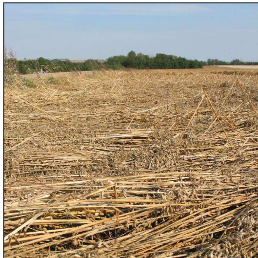
Billede 1. Lejesæd i havre var deværre ikke noget særsyn i 2010.

Canyon, som var sidste års topscorer, er i år forvist til andenpladsen. Dog er Canyon fortsat den sort med højeste hektoliter-vægt. Sammenholder man sidste års resultater