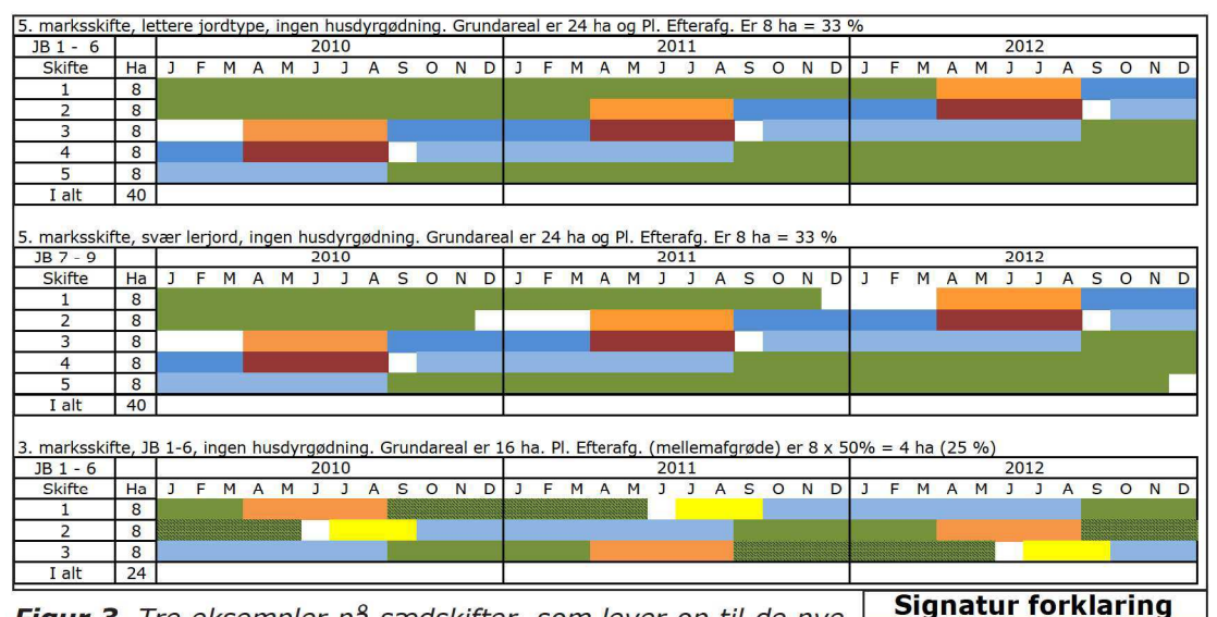
Figur 3. Tre eksempler på sædskifter, som lever op til de nye regler. Der er to 5-marksskifter på henholdsvis JB 1-6 og JB 7-9, hvor der er en almindelig efterafgrøde udlagt i kornet eller sået inden 20/8 efter høst. Det nederste sædskifte er et 3 marksskifte på JB 1-6, hvor de pligtige efterafgrøder udelukkende dækkes af mellemafgrøder. At lægge mellemafgrøden ind, betyder i dette tilfælde at der både laves plads til en rodukrudtsbehandling om sommeren og man undgår at skulle have to vårafgrøder efter hinanden.

Kl.græs Kl.græs el. vikke/rug Vårsæd 1 Vårsæd 2 Vintersæd 1 Jordbeh. = sort jord MA - korsblomst EA - Rajgr./korsbl.