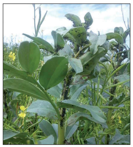
Billede 1. Der blev i 2012 konstateret luseangreb i flere marker med hestebønne. Især Østdanmark var hårdt ramt.

Højeste udbytter er målt i Fuego og Isabel, som tilsyneladende også har haft en lidt lavere angrebsgrad af chokoladeplet. Columbo har indtil videre været den eneste tanninfrie sort, der har været til rådighed for økologer i Danmark, men udbyttet er efterhånden uacceptabelt lavt. Vi må håbe at såsædsfirmaerne ser sig om efter mere højtydende hvidblomstrende sorter til økologerne. Ud fra de svenske forsøg ser sorterne Alexia og Julia begge interessante ud. Alexia skulle komme på markedet som økologisk udsæd i 2013.