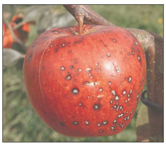
Billede 1. 'Rubinola' er blandt de mest angrebne sorter.

I Danmark har symptomerne på Elsinoe pyri som nævnt været kendt siden 2000 i usprøjtede æbleplantninger, de ses nu også i mange haver. Svampen har ikke tidligere været beskrevet i Danmark eller Skandinavien, og