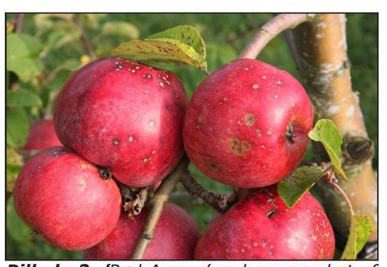
Billede 2. 'Rød Aroma' er her angrebet af både Elsinoe pyri og æbleskurv. "Elsinoe leaf and fruit spot" er de ringformede pletter på bladene og på æblerne til venstre i billedet. Æbleskurv ses som brune pletter midt på æblet til højre.

Indtil videre kan det anbefales at forebygge "Elsinoe leaf and fruit spot" ved at give de angrebne træer en kraftig beskæring.