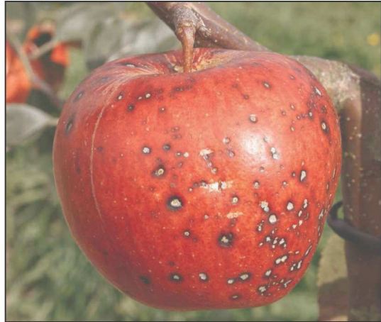
Billede 1. 'Rubinola' er blandt de mest angrebne sorter.

I Danmark har symptomerne på Elsinoe pyri som nævnt været kendt siden 2000 i usprøjtede æbleplantninger, de ses nu også i mange haver. Svampen har ikke tidligere været beskrevet i Danmark eller Skandinavien, og