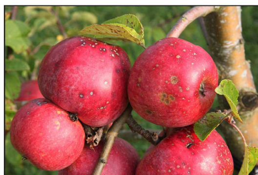
Billede 2. 'Rød Aroma' er her angrebet af både Elsinoe pyri og æbleskurv. "Elsinoe leaf and fruit spot" er de ringformede pletter på bladene og på æblerne til venstre i billedet. Æbleskurv ses som brune pletter midt på æblet til højre.

Indtil videre kan det anbefales at forebygge "Elsinoe leaf and fruit spot" ved at give de angrebne træer en kraftig beskæring.