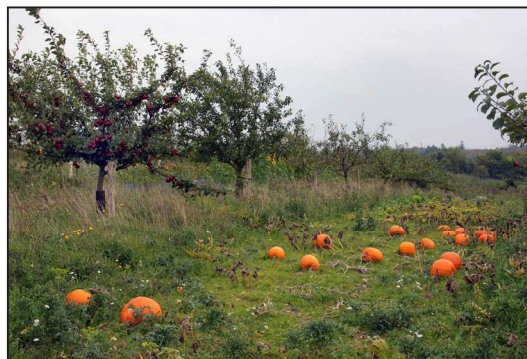
Billede 2. Skovlandbrug i Danmark: Græskar dyrkes her mellem en blanding af frugttræer. Det høje græs i træerækken giver læ til græskarrene. Træerne er 9-10 år gamle og giver nu ca. 30-80 kg frugt pr. træ.

Man kan opnå høje frugtudbytter i sådanne systemer, hvor man jo udnytter træernes store højde. I Schweiz kalkulerer de med 250 kg æbler/træ, og det er ganske realistisk også her, hvor eksempelvis et fritstå-