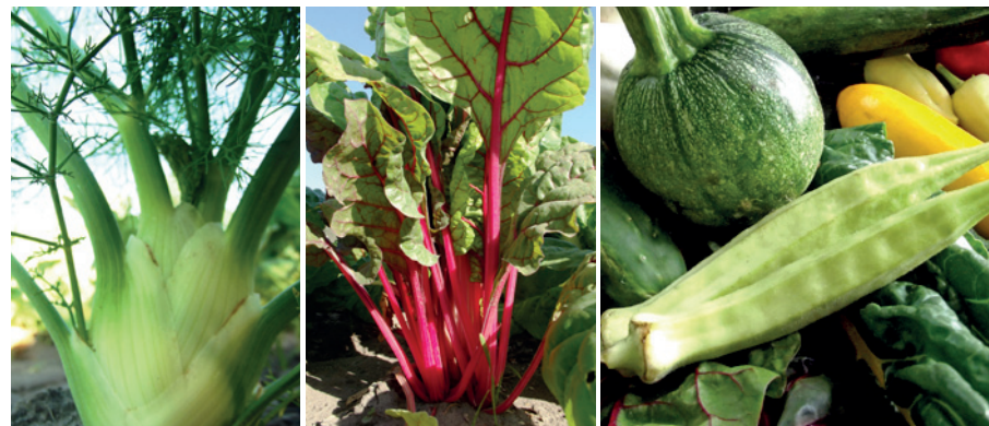
A széles terményskálába a hazai fogyasztók által eddig kevésbé ismert zöldségek is bevonhatók (balról jobbra: édeskömény, mángold, okra)

Kertészeti ismeretek: A közösségi alapú értékesítés a szezon alatt folyamatosan betakarítható termékeket, ennek következtében összetett, sok fajtából és fajtából álló termelést igényel. Ehhez elengedhetetlenek a magas fokú elméleti és gyakorlati zöldségtermesztési ismeretek. A vetésszerkezet tervezéséhez fontosak az ökológiai (vegyszermentes) termesztés növénytársítással és vetésforgóval kapcsolatos ismeretei, a folyamatos ellátás érdekében pedig az egyes fajok és fajták tenyészidő-hosszával kapcsolatos ismeretek. Az ezekkel nem rendelkező termelők számára megfontolandó a fokozatos átállás, azaz először csak kisszámú tag bevonása a rendszerbe. Ahogy egyre inkább rutinszerűen működik a termelés, úgy lehet célszerű a taglétszámot évről évre növelni. A hazánkban jelenleg működő legnagyobb zöldségközösség 2013-ban hetente kb. 60 családot lát el zöldségekkel.