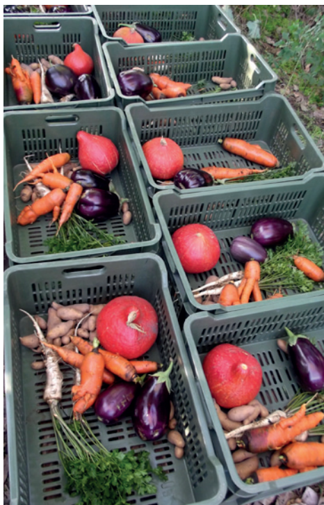
Részarányos zöldségdobozok betakarítás közben

A részarányos gazdálkodás a termelő és a fogyasztó legszorosabb elköteleződési formája. A részarány az éves termés egy részét jelenti, amiért a fogyasztó előre fizet. A gazdálkodó az év elején becslést készít a termelésről és annak költségeiről, valamint kiszámítja a megélhetéséhez szükséges méltányos jövedelmet. A költségeket a gazdasághoz szorosan kapcsolódó vásárlók, vagy más néven tagok között arányosan felosztják. A befizetett összegért cserébe a vásárló rendszeresen megkapja a termék neki járó részét. Egyéni igények teljesítésére a részarányos gazdálkodás esetén legtöbbször nincs mód. A tagok mindig az éppen aktuális terményekből részesülnek. A szerződés és az előre fizetés közös kockázatvállalással jár, a szélsőséges időjárás következtében keletkezett károkat például már nem csak a termelő, hanem a fogyasztó is viseli. Magyarországon a részarányos gazdálkodás kifejezés helyett sokszor a zöldségközösség elnevezést is használják, ami abból adódik, hogy az ilyen rendszerek itthon egyelőre mind (bio)kertészetek. Jelenleg körülbelül fél tucat részarányos alapon szerveződő gazdaság működik hazánkban, melyek közül több 2013 tavaszán kezdte meg működését. A hazai példák esetében a közösségen belül történik az összes megtermelt áru elosztása, a gazdálkodóknak nincs szüksége más értékesítési csatornára.