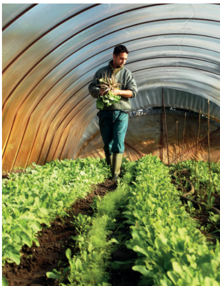
A szállítási szezon meghosszabbítható a termelési infrastruktúra fejlesztésével: zöldségajtatás fóliasátorban.

Adminisztráció: Fontos a kezdeti időszakban a pontos termésadminisztráció, vagyis a különböző termények betakarított mennyiségeinek terület alapú nyilvántartása. Ezzel elősegíthető a következő szezonban a pontos tervezés, az esetleges változtatások könnyebb megvalósítása.