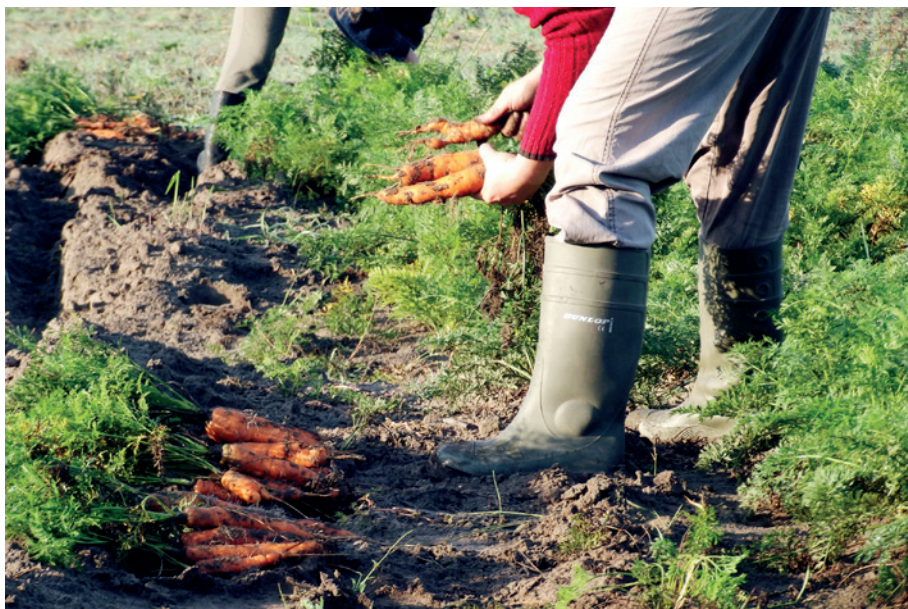
A munkateher kalkulációnál vegyük figyelembe a kisléptékű termelés magas élőlátás igényét

Munkateher kalkuláció: Amennyiben külső munkaerő bevonása indokolt, úgy fontos ismerni a helyi munkaerőpiac helyzetét. A termelési feladatok mellett figyelembe veendő a logisztikához, dobozolásához, szállításhoz szükséges munkaerő igény is.