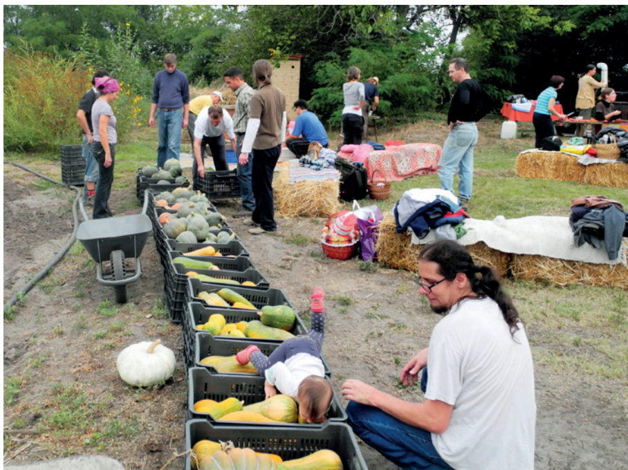
A közösségi eseményeken a zöldségközösség tagjai bepillantást nyerhetnek a termelés folyamataiba

A különböző közösségi kezdeményezések mindegyikében fontos szerepet kap a vásárlók és termelők között kialakult kötődés és szolidaritás. A termékek személyes átvétele gyakran közösségi eseménynek számít, ahol a termelők és a fogyasztók beszélgethetnek a gazdaság működéséről, az aktuális termények konyhai elkészítéséről és megvitathatják az esetlegesen felmerülő problémákat is. A gazdaságok a heti rendszeres átvételen kívül is szerveznek közösségi eseményeket, például egy szezonnal akár több gazdaságlátogatásra, közösségi napra is sor kerülhet. Az ilyen események során a tagok bepillantást nyerhetnek a termelés folyamataiba, ezáltal jobban megismerik az élelmiszerek előállításának módját és magasabb megbecsülés alakulhat ki bennük a termelő munkája iránt. A gazdaságlátogatásokon kívül előfordul kóstolók, családi hétvégék, az egészséges táplálkozással, élelmiszerekkel kapcsolatos foglalkozások szervezése is, ahol a tagok főzéssel, természetes tartósítással és egyéb házi praktikákkal kapcsolatos ismereteket sajátíthatnak el.