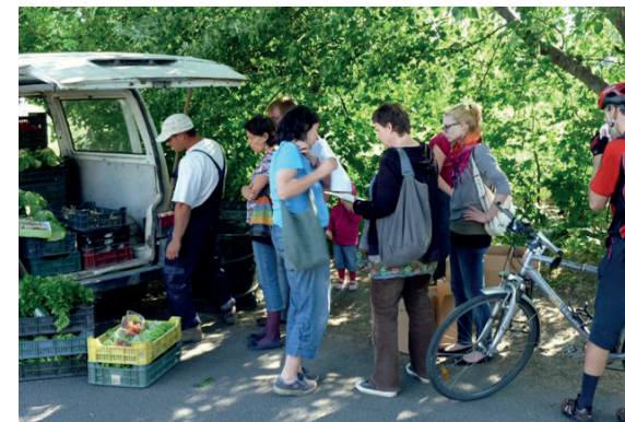
Az átvevőpontok közelsége révén akár kerékpárral is hazaszállíthatók a zöldségek, csökkentve ezzel az élelmiszerrendszer környezeti terhelését

Logisztikai sajátosságok: A piacon történő értékesítéshez képest zöldségdoboz rendszer működtetése esetén jellemzően kisebb az útiköltség és a csomagolóanyag-szükséglet, mivel hetente csak egyszer, általában a gazdasághoz közeli átvevő pontokra történik a szállítás. A pakolással és átvétellel együtt a szállítás általában egy teljes napot vesz igénybe. A logisztikai teendők rutinná válásához időre van szükség, óriási jelentőségű lehet a közösségi koordinátorral való együttműködés, azaz ha a közösség tagjai közül van, aki önkéntes vagy közel önkéntes alapon segítséget nyújt az átvételkor.