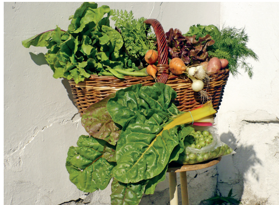
Kora nyári zöldségkompozíció

lehet a más termelőkkel való együttműködés. Ilyen módon rendszeresen vagy megren-delés alapján az érdeklő fogyasztók dobozába kerülhet gyümölcs, tojás, tejtermék, hús és egyéb helyi előállítású minőségi élelmiszer is. A kooperációval szélesíthető a tagok számára elérhető termékkála, miközben más helyi termelőknek is segítünk az értékesí-tésben, és jó szakmai-baráti kapcsolatok kialakítására, megerősítésére nyílnak mód.