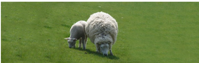
Abb. 3: Gesunde, leistungsbereite Schafe