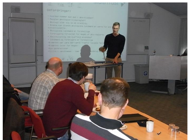
Figur 7 Præsentation af løsningsmodeller