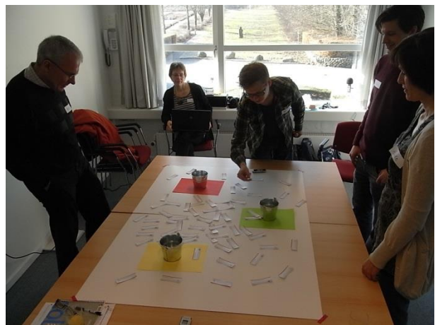
Figur 2 Prioritering af kriterier