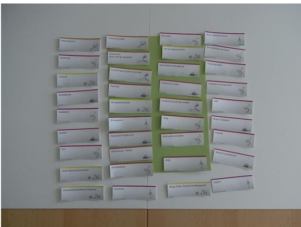
Figur 3 Udvalgte kriterier