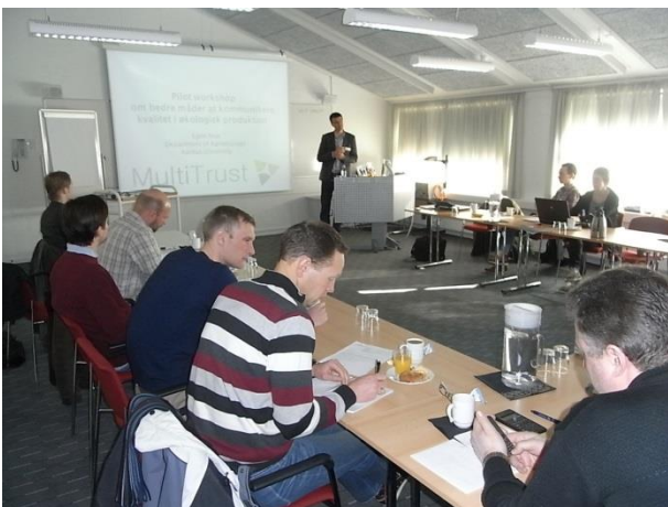
Figur 1 Introduktion