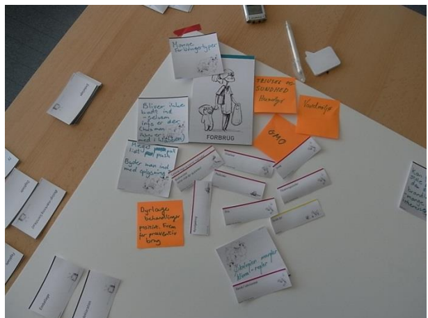
Figur 4 Interessent-analyse