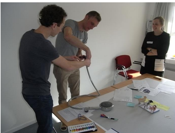
Figur 6 Arbejde med løsningsmodeller