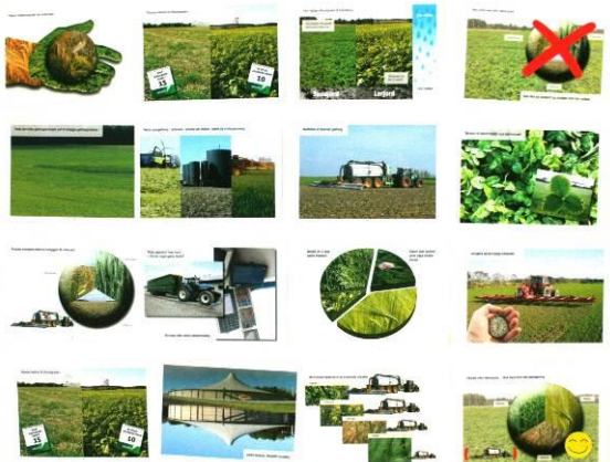
A: Faglige anbefalinger