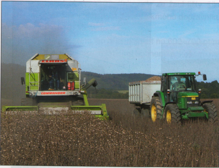
Intenzivní technologie vyžaduje 3–4 týdny před sklizní regulaci zrání Bastou 15. Sklízí se zásadně s makovinou.