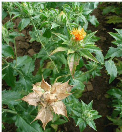
Abb. 1: Saflorknospen mit beginnender Köpfchenfäule als der 2002 am stärksten aufgetretenen Erkrankung

Für eine wirtschaftliche Speiseölerzeugung im Ökologischen Landbau ist es erforderlich, insbesondere bei diesen Eigenschaften nach Genotypen mit günstigeren Ausprägungsstufen zu suchen. Speziell bei Saflor sind Resistenzen gegen verschiedene im humiden Klima auftretende Krankheitserreger (vgl. Abb. 1) aufzuklären, um ausreichenden Kornansatz und somit Öltrag zu gewährleisten. Bei Leindotter müssen in erster Linie Genotypen mit einer günstigeren Fettsäurezusammensetzung und höherer TKM gefunden werden.