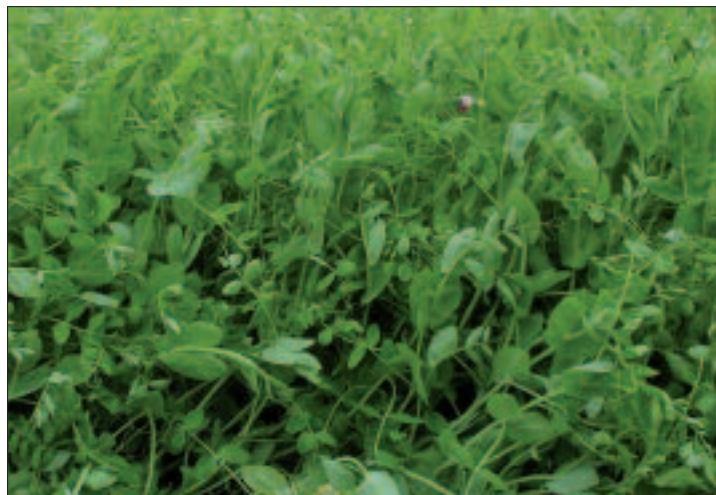
Die Wintergrasigerbse E.F.B. 33 bildet dichte Bestände, die das Unkraut gut unterdrücken. Zur Körnerernte ist sie hingegen nicht geeignet.