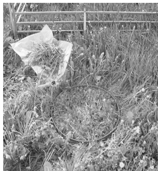
Abbildung 2: Probenahme auf der Weide

In zweiwöchigem Abstand erfolgte exemplarisch eine Heuaufnahmemessung. Dafür wurde ein Rundballen auf einer elektronischen Viehwaage (max. 2000 kg, \pm 0,5 kg Stufung) verwogen und die auf dem Futtertisch verbliebenen Restmengen nach 24 Stunden durch Rückwiegung mit-