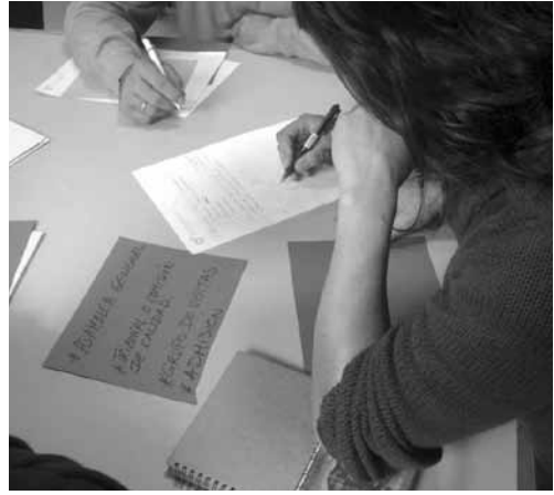
I Encuentro interterritorial del proceso de SPG andaluz. Santa Fe (Granada).