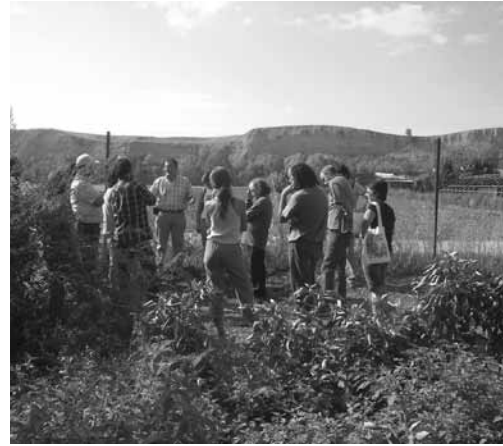
Ensayo visita de campo. III Encuentro interterritorial del proceso de SPG andaluz. Cooperativa la Acequia (Córdoba).

mucho, pero a la hora de comérselo es un bocado exquisito. No debe perderse. Yo creo que un noventa... más del noventa por ciento de la gente que siembra sus tomates siembra los de aquí. Por la calidad (P2)