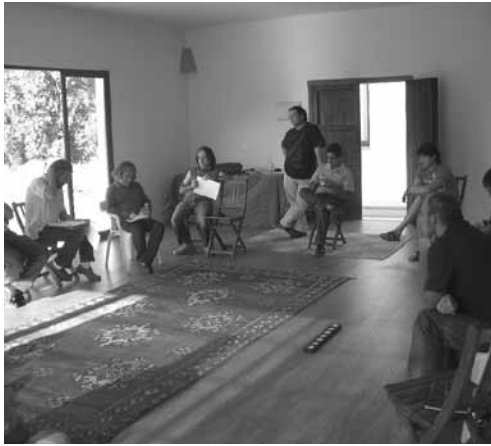
III Encuentro interterritorial del proceso de SPG andaluz. Finca l'Aljara (Córdoba).