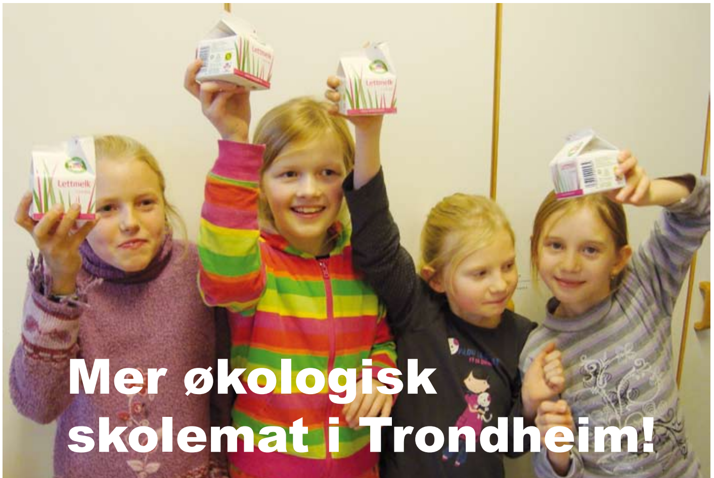
Elever ved SFO på Berg skole i Trondheim ser ut til å trives med økomekk på kartongen.

Trondheim kommune vil øke andelen økologisk mat i skoler og barnehager. Derfor er kommunen valgt til å være et norsk "case" i forskningsprosjektet "Økologisk mat til ungdommen" (iPOPY). Økologisk skolemelk er tilgjengelig i Trondheim, og en høyere andel økomekk kan bidra til å innfri kommunens målsetning. Etter kraftig prisstigning, er salget av økologisk skolemelk nå drastisk redusert på landsbasis.