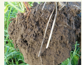
Fig. 2: Colonisation du sol par les racines sous un mélange graminées-légumineuses.