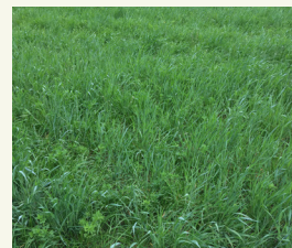
Fig. 1: Mélange graminées-légumineuses, peut également être utilisé pour la pâture

Un groupe bien étudié de mélanges d'espèces est celui des mélanges graminées-légumineuses (fig. 1). De tels mélanges permettent une excellente répartition des racines dans le sol (fig. 2). De plus, les mélanges ayant une proportion de 40 à 60 % de légumineuses peuvent augmenter la fixation de l'azote par les légumineuses par rapport aux cultures de légumineuses pures (Nyfeler et