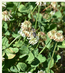
Fig. 3: Le trèfle blanc est une excellente plante nourricière pour les abeilles mellifères.

sateurs en général (fig. 3). La plupart des cultures agricoles fleurissent au printemps et au début de l'été. Les couverts végétaux sont un excellent moyen de fournir du pollen et du nectar aux abeilles pendant l'été et l'automne. Les légumineuses, les crucifères, le sarrasin et la phacélie sont d'excellentes plantes pour nourrir les abeilles. La phacélie notamment (fig. 4) est souvent cultivée dans le but spécifique de les nourrir.