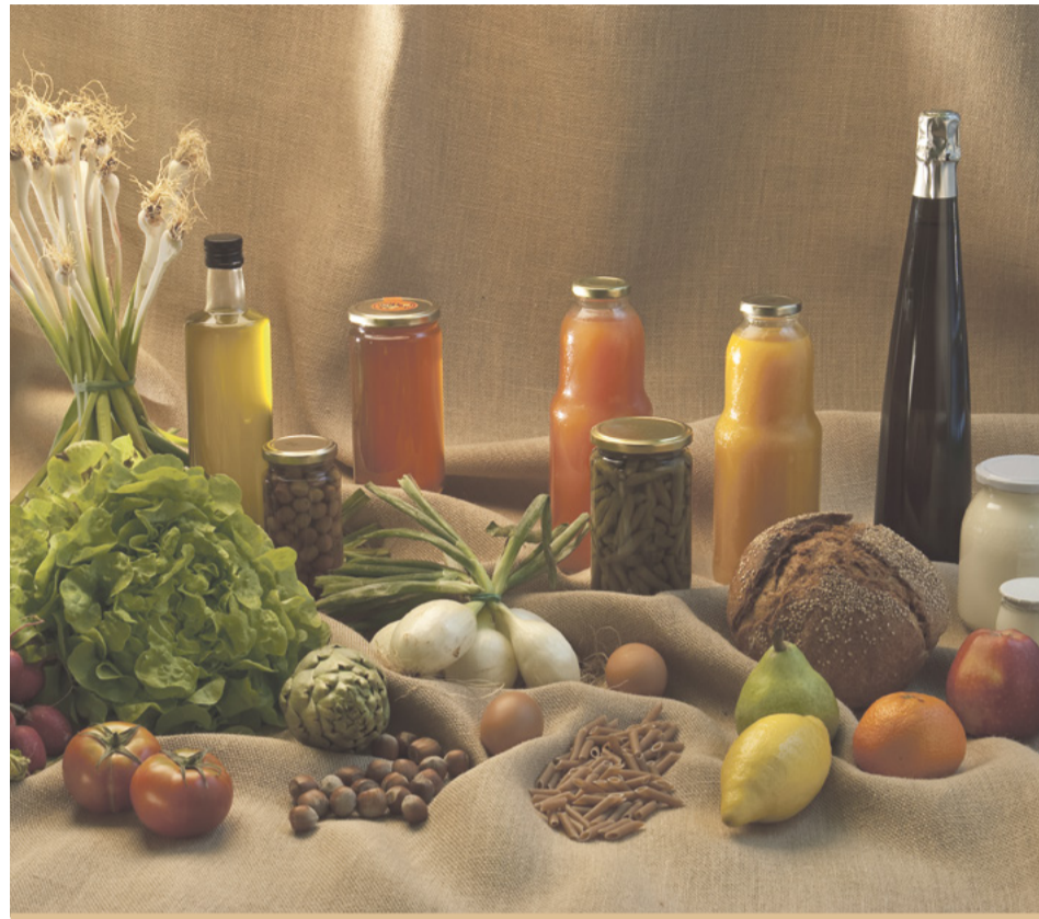
Bodegó productes ecològics

A més, la pandèmia mundial ha posat en relleu la necessitat de materials de formació digital als quals es pugui accedir de manera remota. Això també permet incrementar-ne l'abast. Un exemple d'aquests materials de formació digitals és el projecte StartupBio d'Erasmus + en curs, que aborda els problemes abans esmentats oferint materials de formació digitals als nous vinguts a l'agricultura ecològica en quatre països mediterranis. Dirigit a nous agricultors, així com a agricultors en conversió amb seu a Espanya, Itàlia, Portugal i Grècia , el projecte ha desenvolupat cursos d'aprenentat-