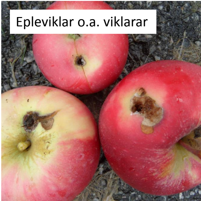
Epleviklar o.a. viklarar