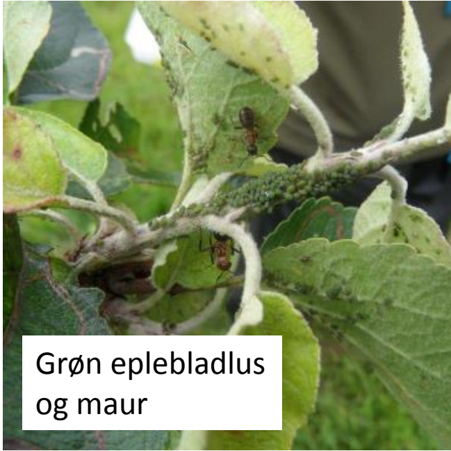
Grøn eplebladlus og maur