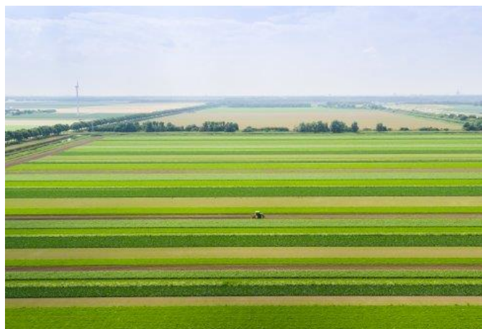
La strip cultivation è diffusa soprattutto nel Nord Europa

La strip cultivation (o strip cropping o strip farming) è un nuovo approccio all'agricoltura che prevede di seminare colture differenti in uno stesso campo , coltivandole a strisce, più o meno ampie, alternate tra di loro. Il metodo è applicato sia nel Nord che nel Sud Europa (Mediterraneo) su colture orticole rappresentative dei differenti areali pedo-climatici; ha il pregio di sfruttare le sinergie tra piante differenti che possono aiutare l'agricoltore a ridurre l'apporto di input produttivi e a gestire meglio parassiti e malerbe.