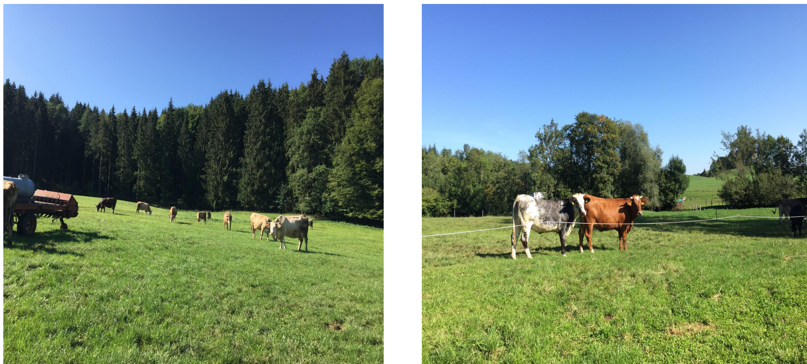
Abb. 1: Kühe auf der Weide im Südwestens Deutschlands

Das europäische Grasland ist durch eine große Pflanzen- und Insektenvielfalt charakterisiert. Die Art der Landbewirtschaftung (z.B. Beweidung) spielt bei dem Erhalt dieser Vielfalt eine herausragende Rolle. Weidetiere wie Milchkühe prägen die Vegetationsstruktur und fördern die Artenvielfalt des Grünlandes (Abb.1).