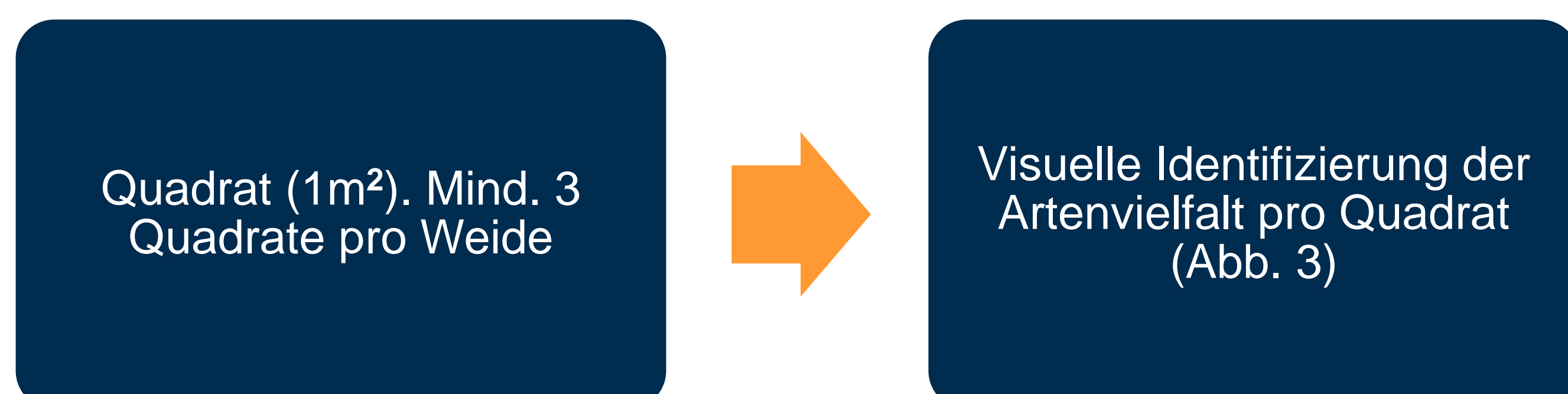
Abb. 2: Bestimmung der Biodiversität

Die Milchviehbetriebe wurden den Regionen (1) Nördlich der Schwäbische Alb (5 Betriebe), (2) Schwäbische Alb (10 Betriebe) und (3) Oberschwaben und Allgäu (13 Betriebe) zugeteilt.