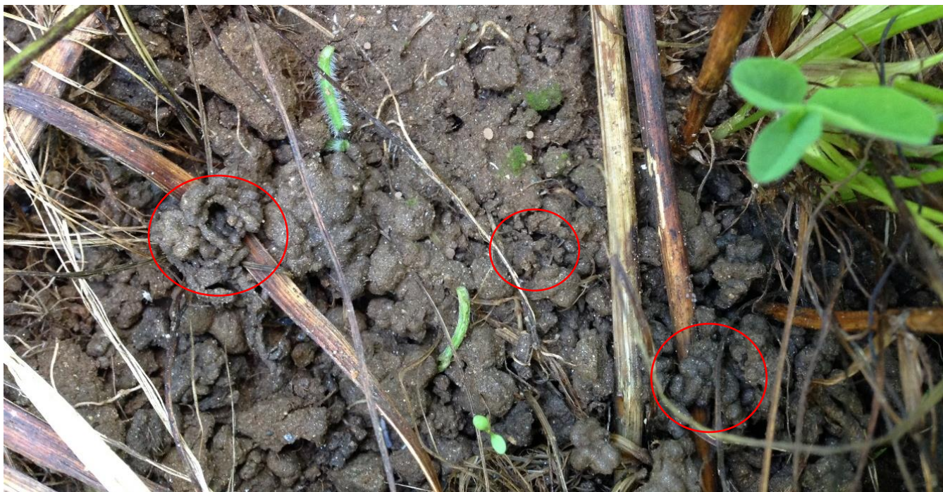
Jordoverflata i ei gras/kløvereng, med organisk materiale i ulike faser. Her fins alt fra levende planter, ferske, grønne stengelbiter, stengler og blad av eldre planter, til de mer avrunda jordklumpene (i sirklene) hvor meitemark og jordliv har innarbeidet organisk materiale og karbon.