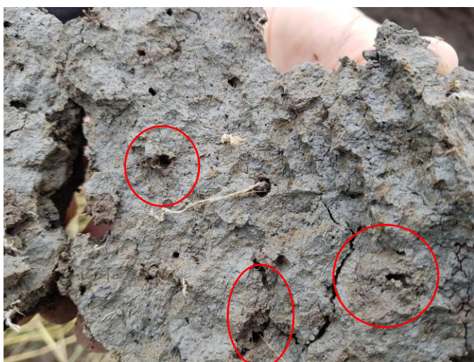
Leirjord fra ca. 30 cm dyp, med ganger etter meitemark og røtter. I og rundt mange av hullene kan du se brunfarget organisk materiale med mer karbon enn i jorda ellers. Det stammer fra meitemarkskitt, mikroorganismer og planterøtter som lever i meitemarkgangene.

Når planter og organismer dør, blir de brutt ned og noen stoffer blir bygget om og inn i organiske molekyler i jordaggregatene, i det vi kaller humus og mold. Karbonlagringen i jord blir dermed svært dynamisk. Mest karbon forbrukes og bare litt lagres, så jevnlig tilførsel av nytt karbon er nødvendig dersom noe skal lagres over tid.