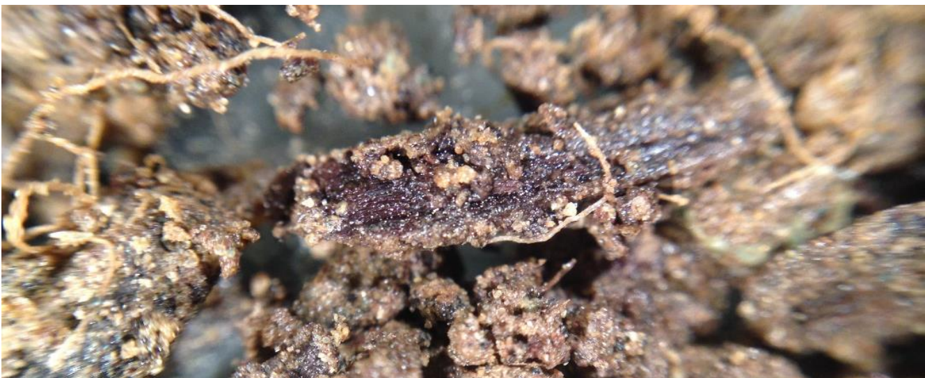
En synlig planterest (brun) med karbon i celleveggene under omdanning til andre former for organisk materiale i jord. Øverst til venstre og litt ellers ses noen rester etter planterøtter.

Siden flere prosesser skjer samtidig og påvirkes av det økosystemet som karbonet befinner seg i, er det bare mulig å forutsi hvor karbonet tar veien i grove trekk. Det er det totale økosystemet på jordet som bestemmer mengden karbon i jorda, slik at både hva som produseres, hvordan, hvor mye som høstes og tilføres, i tillegg til jordsmonn, jordbiologi og miljøforhold bidrar inn i karbonregnskapet.