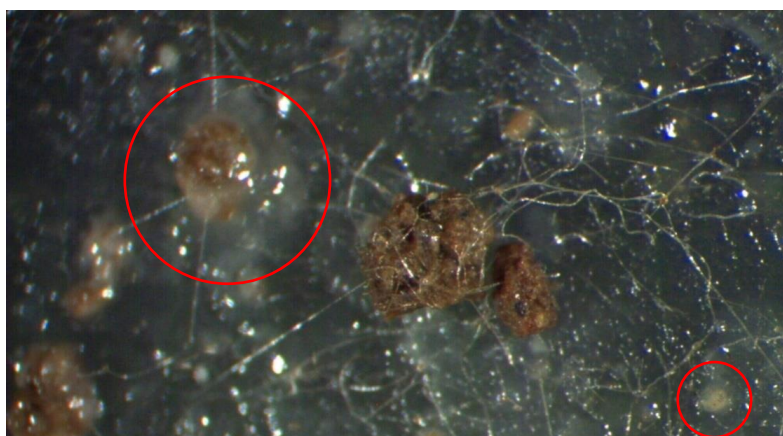
Brunfargete jordaggregater fra en kornplanterot (bygg), to dager etter at de er lagt på en svart plate med ekstra næring. Sophyfer (de tynne trådene) og bakteriekolonier i form av mer geleaktige klumper (i sirklene) har oppformert seg på og i jordklumpene. Organisk materiale i jordklumpene blir her omdannet til bakterie- og soppbiomasse, kalt mikrobiell biosyntese.

Mikroorganismer lager nye molekyler som kan inngå i humus og humusmolekyler. Eksempelvis stabile molekyler , som noen typer polysakkarider (Gobat m. fl. 2004), glomalin fra mykorrhizasopp (Rilling m. fl. 2002), trehalose i ulike celletyper (Elbein m. fl. 2003) og kitin. Også mindre stabile molekyler innen polysakkarider, aminosyrer, alkoholer og peptider som sopp og bakterier lager, kan inngå i humusmolekylene (Stevenson 1994). DNA og proteinrester fra døende celler er andre kilder til humusmolekyler (Pepper m. fl. 2015). Mikrobielle produkter og organismene i seg selv er viktige bestanddeler av organisk materiale i jord (Schmidt m. fl. 2011, Miltner m. fl. 2012).