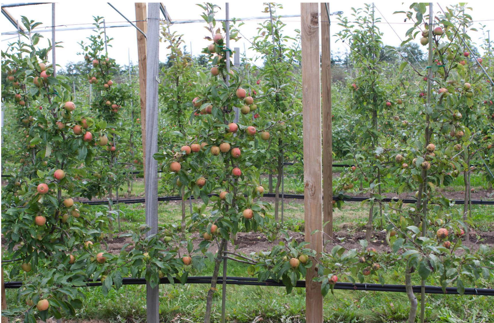
2. Tree under roof