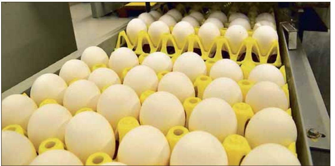
PROTEINER: Eggeskallhinner er rike på verdifulle proteiner og aminosyrer. De kan brukes både som tilsetning i fôr og som kalkingsmiddel.

Norilia er et datterselskap til Nortura, som tar seg av restråstoff som ikke kan utnyttes til mat, deriblant eggeskall.