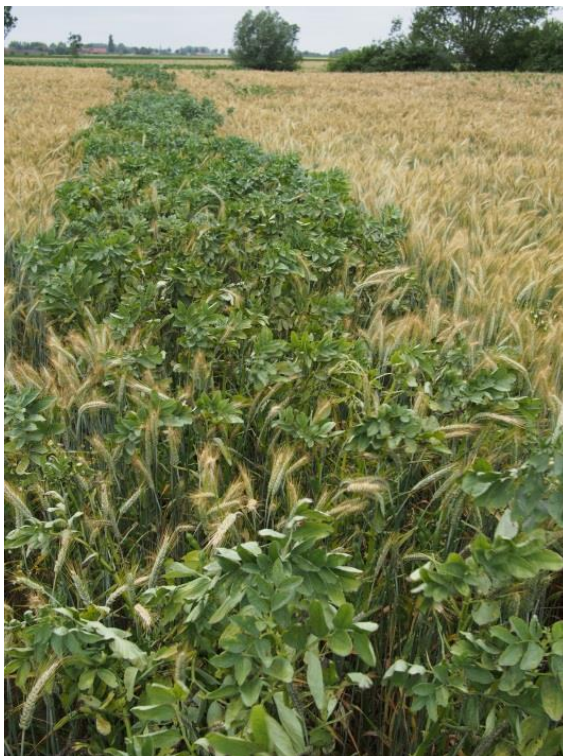
Foto 2: Winterveldboon Arthur was opvallend competitief tegenover de triticale Vuka.

Hiverna werd voor de tweede keer in proef opgenomen en deed het dit jaar goed. Dit ras is algemeen in de Duitse biologische teelt dankzij een goede winterhardheid. Het ras is laat maar was op 2 augustus toch goed afgerijpt. Axel is een nieuw ras dat een goede korrelopbrengst haalde. Arthur is ook nieuw en maakte een fors gewas met een goede korrelopbrengst. Met het hoge aandeel veldboon, ongeveer de helft, bracht dit gewas het meeste eiwit aan.