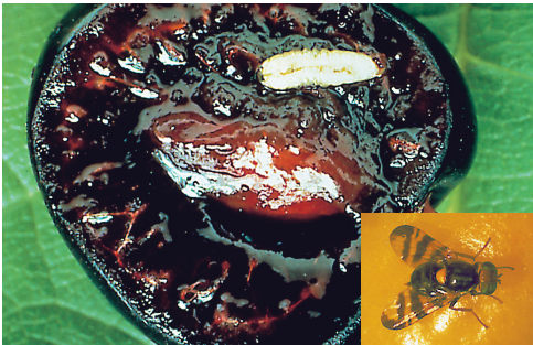
☞ Abb. 1: Die Kirschfruchtfliege ( Rhagoletis cerasi ) ist der Schlüsselschädling in der biologische Süßkirschenproduktion.

Auf 11 Obstbaubetrieben in der Nordwestschweiz testete das FiBL verschiedene neue Ansätze zur Bekämpfung der Kirschfruchtfliege. Die Resultate sind ernüchternd.