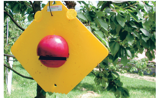
☞ Abb. 2: Die israelische Frutect-Falle, eine Kombination aus visuellen und olfaktorischen Reizen, die bisher einzige Bekämpfungsmöglichkeit. Nachteile: unzureichenden Wirkung und hoher Arbeitsaufwand